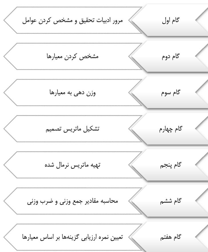
شکل ۱. گام‌های اجرای پژوهش

تبلیغات یک پدیده میان رشته‌ای است که توسط محققان در این زمینه مورد بررسی قرار گرفته است و با ظهور اینترنت و شبکه‌های اجتماعی روش‌های تبلیغات در دنیا به این سمت کشیده شده است (چو و کانگ، ۲۰۰۶). در پژوهش حاضر، شبکه‌های اجتماعی مناسب تبلیغات، از مرور ادبیات تحقیق استخراج شدند؛ سپس با نظر خبرگان، معیارهایی برای ارزیابی این روش‌ها تعریف شد. در این پژوهش از ۱۰ خبره در حوزه رسانه و بازاریابی بهره برده شده است. این خبرگان از دو بخش صنعت و دانشگاه انتخاب شدند تا ترکیب مناسبی برای نظرسنجی وجود داشته باشد. به عبارت دیگر، این خبرگان افرادی بودند که در واحد بازاریابی شرکت، حداقل ۵ سال سابقه کار داشتند و در پست مدیریتی فعالیت می‌کردند یا از اساتید مدیریت رسانه و بازاریابی در دانشگاه بودند. پس از مشخص شدن معیارها، پرسش‌نامه‌ای بر مبنای استاندارد مقایسه‌های زوجی طراحی و در اختیار خبرگان قرار گرفت. در محاسبه‌های نهایی این پژوهش، برگرفته از روش یزدانی، زارته، کازیمیراس زاوادسکاس و تورسکیس ۱ (۲۰۱۹)، از روش تصمیم‌گیری چندمعیاره کوکوسو استفاده شد که برای محاسبه‌های مربوط به تصمیم‌گیری چندمعیاره به کار می‌رود. برای صحت‌گذاری روش نیز، در انتها از تحلیل حساسیت استفاده شد. جزئیات این روش و فرمول‌های آن، در بخش بعد گام‌به‌گام توضیح و در شکل ۱ به نمایش گذاشته شده است.