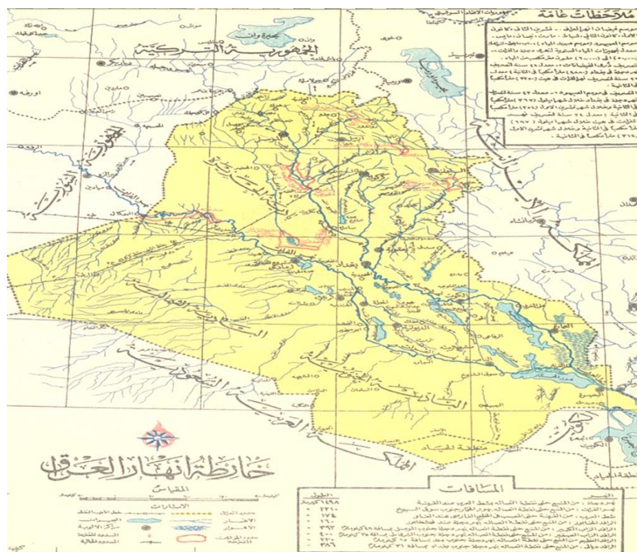
نقشه رودهای عراق (سوسه، 1353)

اهمیت حیاتی شبکه آب‌های عراق، به‌ویژه اهمیت مدیریت آب‌های عراق در قالب ایجاد بندها، کانال‌ها و نهرهای مصنوعی در پیدایش، رشد و توسعه شهرهای میان‌رودان و وضعیت اقتصادی ساکنان این منطقه نقش بسیار زیادی داشت (دشتی، 1384: 59). که در ادامه اشاره می‌شود.