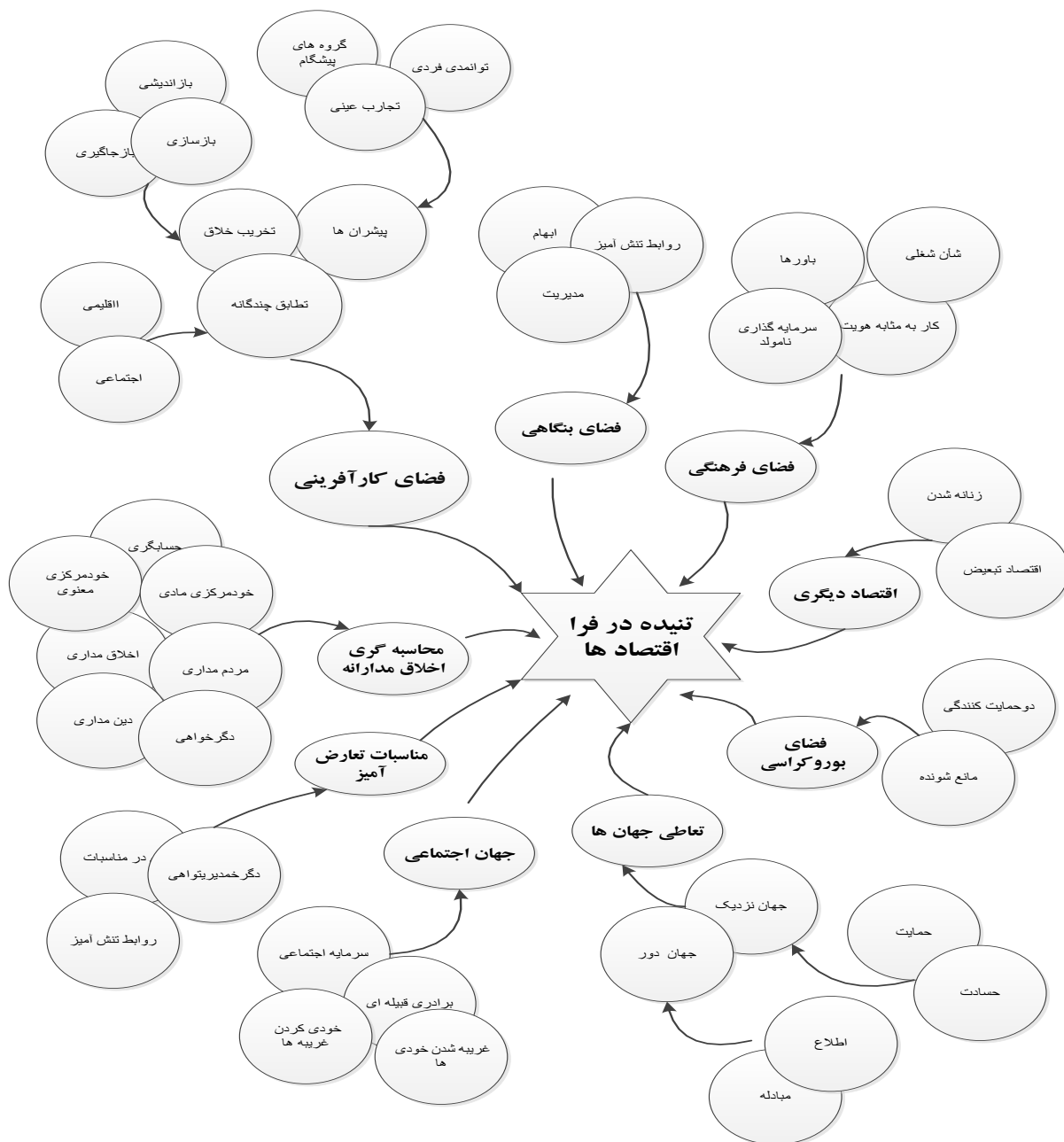
شکل ۱. فضای مفهومی کنش اقتصادی در ایران

یافته های تحقیق نشان می دهند که بر خلاف مفروضات اقتصاد کلاسیک و نئوکلاسیک، کنش اقتصادی "فک شده" از اجتماع نیست، بلکه حک شده و درهم تنیده با اجتماع است. از فضای مفهومی استحصال شده کنش اقتصادی با منطق استقرای کیفی تنها یک مقوله از ۳۱ مقوله سطح دو، با مفروضه انسان بیشینه ساز سود همخوان است و سایر اجزا و عناصر این فضای مفهومی بیانگر تنیدگی و حک شدگی کنش اقتصادی در محیط اجتماعی و فرهنگی است. فراترکیب مطالعات نشان داد که کنش