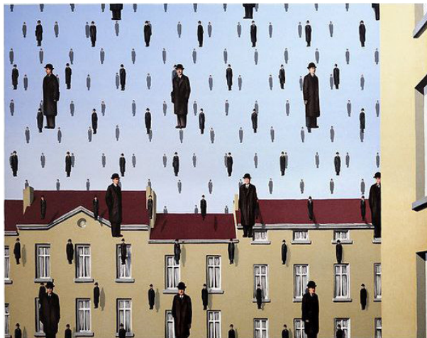
تصویر ۱. گولکوند (۱۹۵۳).

رفته‌اند تا موقعیت بهتری برای غلبه بر جامعه (زنان) به دست آورند؛ وقتی تکنولوژی و فضای مجازی بر شهر غلبه کرد، انسان‌ها ابتدا شبیه به هم شده و سپس یکی‌یکی سبک‌وزن شده و به هوا رفته‌اند یا شاید این صحنه، نمودی از همان برادر بزرگ ۲۳ مشهور باشد که جورج اورول در زمان ۱۹۸۴ از آن می‌گوید؛ شخصیتی نادیدنی که حالا در یک نمایش عروسکی، حضور فیزیکی دارد و ناظر بر تمام فعالیت‌ها و زندگی شهروندان است.