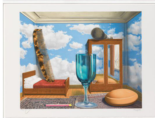
تصویر ۳. ارزش‌های شخصی (۱۹۵۲).

گیلاس (لیوان) و صابون و یک چوب کبریت بسیار بزرگ روی زمین قرار دارد و فرچه آرایش صورت غول‌پیکر روی کمد آرمیده است. دیوارهای اتاق با تصویر آسمان آبی همراه با ابرهای سپید پوشانده شده؛ گویی کاغذ دیواری با چنین طرحی آن را پوشانده است. چنین تصویری در بستر نمایش عروسکی به راحتی می‌تواند به تئاتر تبدیل شود؛ چراکه اشیای بزرگ‌شده هم با ویژگی کوچک‌سازی و بزرگ‌سازی در تئاتر عروسکی هماهنگ هستند و هم می‌توانند وجهی نمادین داشته باشند و هم با اندازه بزرگشان وجهی خیالی در زمینه واقعی می‌سازند؛ از این رو کل فضا را دارای ماهیتی فانتاستیک می‌کنند.