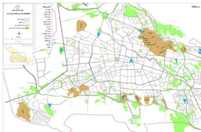
شکل ۲. نقشه سکونتگاه‌های غیررسمی شهر تبریز

شهر تبریز به عنوان یکی از کلان‌شهرهای کشور، به عنوان مقصد مهاجرین در منطقه شمال غرب کشور مورد توجه بوده و به دلیل عدم مطابقت شرایط اجتماعی و اقتصادی جمعیت مهاجر با ساختار قیمت زمین و مسکن در داخل شهر تبریز، به زمین‌های اطراف شهر رانده می‌شوند. تداوم مهاجرت روزافزون جمعیت به شهر تبریز، احداث مسکن با سازه ناپایدار و مصالح نامرغوب، سکونت اقشار فقیر با مشاغل ناپایدار و نامشخص، نرخ رشد بالای جمعیت، شبکه ارتباطی نامناسب و غیره را در سکونتگاه‌های غیررسمی شهر در پی دارد (نعمت‌اللهی، ۱۳۹۴). علیرغم اینکه داشتن آمار دقیق یکی از پیش‌نیازهای ضروری برای برنامه‌ریزی و تصمیم‌گیری در خصوص جمعیت ساکن در سکونتگاه‌های غیررسمی است، بنا به دلایل نامعلوم آمار دقیقی از جمعیت سکونتگاه‌های غیررسمی در درگاه‌های آماری دستگاه‌های مرتبط نظیر وزارت کشور، شهرداری‌ها و مرکز آمار منتشر نشده است. با این وجود می‌توان مناطق مسکونی که در دسته‌بندی‌های شهری به عنوان بافت حاشیه‌ای و سکونتگاه‌های غیررسمی قرار گرفته‌اند، را بیش از ۴۰۰ هزار نفر برآورد کرد (مبارک بخشایش و همکاران، ۱۴۰۱: ۲۴۴). که در چهار پهنه شمالی، شمال غربی (محل پارک بزرگ تبریز)، جنوبی و جنوب غربی (شکل ۲) پراکنده شده‌اند.