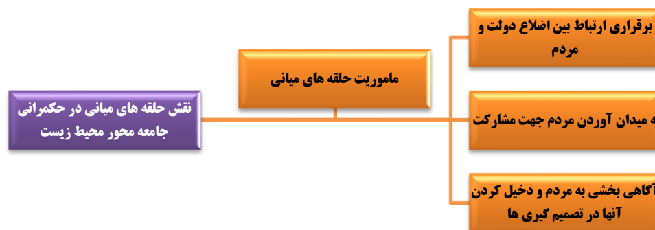
شکل ۳. مدل مفهومی مأموریت حلقه های میانی در حکمرانی جامعه نگر محیط زیست

در ابتدا پیشینه های پژوهش با واژگان حکمرانی مردمی از یک سو و حلقه های میانی و مشارکت مردمی از سوی دیگر مورد بررسی قرار گرفت. در ادامه با الهام از بیانات رهبر معظم انقلاب در دیدار با دانشجویان در خردادماه سال ۱۳۹۸، محتوای پژوهش درباره کارکرد و اهمیت حلقه های میانی غنی گردید. حال با توجه به مطالب بیان شده و باهدف تحقق حکمرانی مطلوب محیط زیستی در جهت نیل به تمدن نوین اسلامی، موارد ذیل استخراج شد: