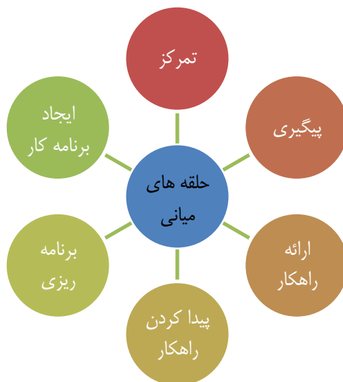
شکل ۱. وظایف حلقه های میانی در بیانات مقام معظم رهبری