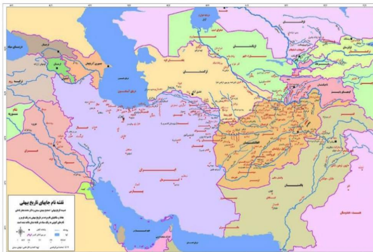
نقشه ۱. نام‌های تاریخی بیهقی

آنان تا اندازه‌ای مانع ستمگری و رفتار خودسرانه کارگزاران دولت بودند».