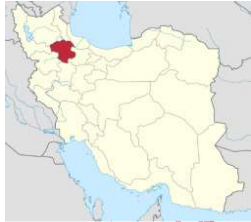
شکل ۲. نقشه موقعیت جغرافیایی استان زنجان