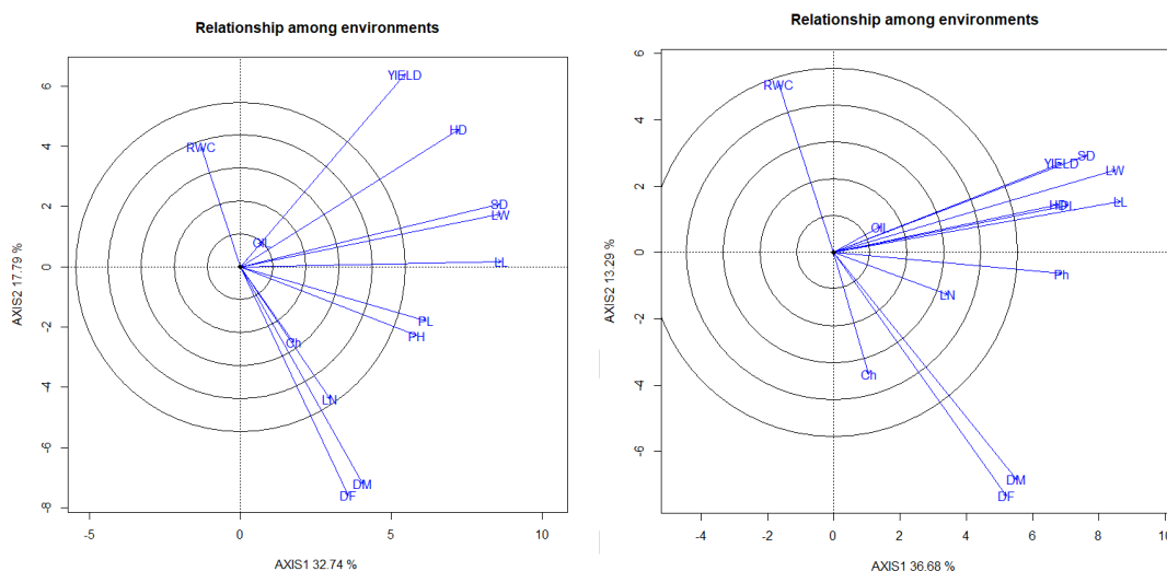
شکل ۲- Error! No text of specified style in document. بای پلات نقشه همبستگی بین صفات مورد مطالعه در شرایط نرمال (راست) و تنش خشکی (محدودیت آبیاری) (چپ)

Correlations greater than or equal to 0.193 are significant at the five percent probability level and correlations greater than or equal to 0.251 are significant at the one percent probability level. In the correlation table, the top of the main diameter shows the correlation between traits under normal conditions, and the bottom of the main diameter shows the correlation between traits under drought stress conditions (irrigation limitation). Plant height (PH, cm), number of leaves (LN), leaf length (LL, cm), leaf width (LW, cm), petiole length (PL, cm), stem diameter (SD, cm), chlorophyll (Ch), days to flowering (DF, day), days to maturity (DM, day), diameter according to (HD, cm), relative water content (RWC, %), seed oil content (Oil, %), and yield (Yield, g).