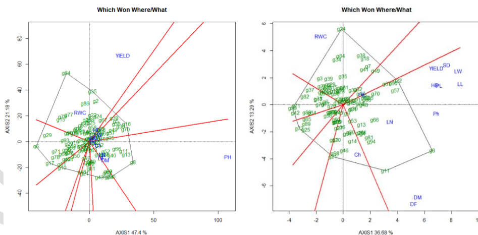
شکل ۱- چند ضلعی GT-Biplot برای تعیین ژنوتیپ برتر در شرایط نرمال (سمت راست) و تنش خشکی (محدودیت آبیاری) (سمت چپ)

(ENSAT)، ۱۶ (RHA266)، ۷۰ (SDB1)، ۳۵ (H603R)، ۸۴ (ایرانی ۳۶)، ۶ (H209A/83HR4)، ۱۷ (PAC2)، ۲۱) 254-2) ۴۳ (LP-SCYB)، ۲۰ (15038) و ۴ (AS5306) بودند. در این میان، ژنوتیپ شماره ۸ (-254-ENSAT)، از نظر صفات کلروفیل، روز تا رسیدگی، روز تا گلدهی، طول دمبرگ، تعداد برگ و ارتفاع بوته مطلوب بود. ژنوتیپ‌های رأسی ۳۵ (H603R)، ۸۴ (ایرانی ۳۶) و سایر ژنوتیپ‌های موجود در ناحیه مربوطه واکنش خوبی از نظر صفت عملکرد و محتوای نسبی آب داشتند (شکل ۱). بنابراین ژنوتیپ‌های رأسی فوق، از نظر صفات عملکرد و محتوای نسبی آب مطلوب‌ترین بودند، در حالی که در ناحیه مربوط به ژنوتیپ‌های رأسی ۱۷ (PAC2)، ۶ (H209A/83HR4)، ۲۰ (15038)، ۴۳ (LP-SCYB)، ۴ (AS5306)، ۲۱ (1009337(K100)) و ۱۰ (1009329(K100)) هیچ صفت شاخصی حضور نداشت و ژنوتیپ‌های واقع در این ناحیه از نظر مجموع صفات ضعیف ارزیابی شدند. در مجموع تحت شرایط نرمال و تنش خشکی (محدودیت آبیاری) ژنوتیپ ۸ (254-ENSAT)، از مقادیر بالایی در اکثر صفات برخوردار بود. استفاده از بای پلات چندضلعی ژنوتیپ در صفت برای مقایسه، انتخاب ژنوتیپ و در تعیین رابطه بین صفات و ژنوتیپ، در گیاهان متعددی همچون سویا (Yan and Rajcan, 2002)، کلزا (Hosseini, 2016)، ذرت (Shojaei, 2020)، باقلا (Sheikh et al. , 2022)، توتون (Porkabiri et al. , 2019a; 2019b) و سورگوم (Kaplan et al. , 2017) گزارش شده است.