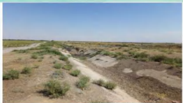
شکل - کانال خشک شده آب در تاجیکستان

سال 2022 دو بویلر به صورت اضطراری در CHPP 1 شهر ریدر خاموش شدند که به دنبال آن بیست هزار خانواده و کسب و کار کوچک در سرمای شدید و بدون منبع گرمایی رها شدند. از این دست مثال‌ها که نشان‌دهنده افزایش اسهتلاک ظرفیت منابع است، بیشتر هم وجود دارد. برای تغییر این شرایط و استفاده از توانایی‌های درونی نیاز به میل و اراده سیاسی، منابع، نظم و کمک گرفتن از جمعیت مردم و نشان‌دادن نتایج اولیه آن است که ممکن است از همان اول خیلی مثبت نباشد.