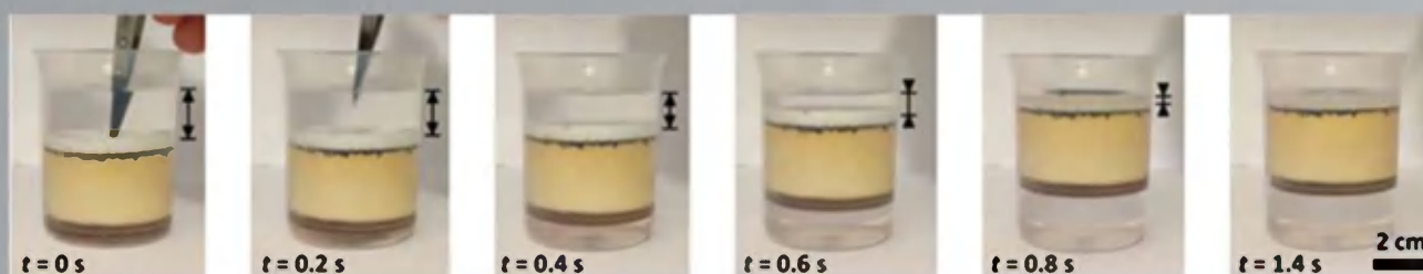
شکل - ساختار لایه آب تحت جابجایی

حتی اگر از انرژی تجدیدپذیر به بهترین شکل استفاده نموده است به علت تجهیزات گران قیمت نمی‌توان در حد کمال، استفاده مطلوب داشت. بنابراین نیاز به تحقیق بیشتر در این زمینه است. با این وجود، پتانسیل نیروگاه‌های نمک‌زدایی با انرژی خورشیدی برای مقابله با کمبود آب امیدوارکننده است. تحقیقات بیشتر و پیشرفت‌های فناوری احتمالاً این راه حل را در آینده قابل اجرا تر و گسترده‌تر خواهد کرد.