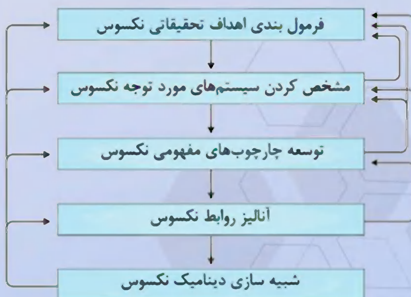
شکل - پنج گام اصلی در اجرای روش‌های نکسوسی

معمولا با هدف شناخت منافع مشترک نکسوس، تبادلات و هم‌افزایی‌ها در راستای بهینه سازی استفاده از منابع و تولید، برای رسیدن به امنیت آبی، امنیت غذایی، سلامت انسان و امنیت انرژی بوده است. اکثر مطالعات روی سوالات خاص نکسوس‌ها است (برای مثال، چگونه می‌توان از مشارکت بخش آب با تکنولوژی‌های جدید در بخش‌های دیگر سود ببریم؟). برخی دیگر تمرکز را بر روی حل مسائل خاص گذاشتند. هرچند که هنوز اهداف توسعه پایدار خاصی به مطالعات کمی نکسوسی ارتباط پیدا نکرده‌اند.