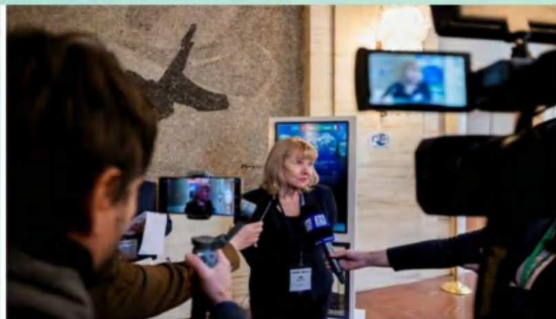
شکل - مصاحبه یکی از نمایندگان بعد از کنفرانس

اتحادیه اروپا و بانک جهانی نقش کلیدی را در بهبود و حمایت از اصلاحات، انطباق با رویکردهای جدید و تأمین مالی پروژه‌هایی که از اهمیت اجتماعی برخوردارند و بخش خصوصی خیلی علاقه‌ای به آن ندارد را دارند. در چند سال آینده اتحادیه اروپا قصد دارد 200 میلیون یورو را به حل مسایل محیط زیستی در آسیای مرکزی و ظرفیت‌سازی جهت تبدیل شدن به اقتصاد سبز اختصاص دهد. اما صرفاً تلاش ارگان‌های دولتی برای تبدیل کامل به اقتصاد سبز کافی نیست و همکاری بخش‌های خصوصی یک امر لازم است که در رابطه با مشکلات