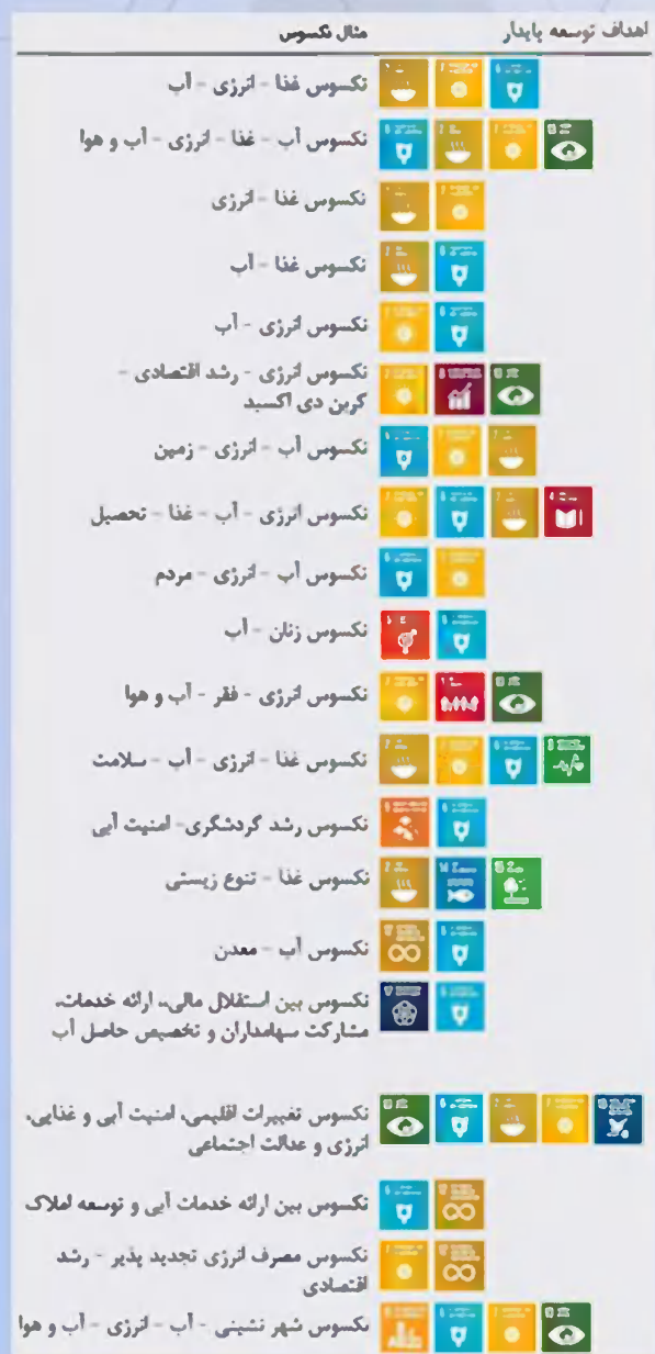
شکل - ارتباط نکسوس‌ها پیشنهادی با اهداف توسعه پایدار

در این مقاله به بررسی دو سوال کلیدی می‌پردازیم. چه قدم‌هایی برای پیاده سازی رویکردهای نکسوسی حیاتی هستند؟ مسیرها و شکاف‌های اصلی در تحقیقات چه هستند؟ همچنین راجب این که چگونه تفکر نکسوسی به ما برای