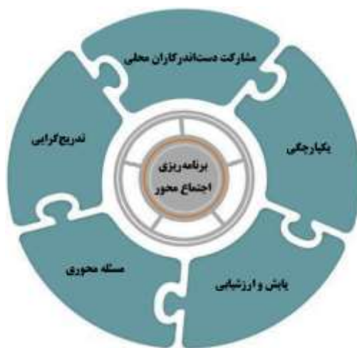
شکل ۲. اصول بنیادین برنامه‌ریزی پیشنهادی

در یک جمع‌بندی کوتاه از نگاه مصاحبه‌شوندگان، برنامه‌ریزی بایستی دارای اصولی از قبیل یکپارچگی، مشارکت دست‌اندرکاران محلی، مسئله‌محوری، تدریج‌گرایی، پایش و ارزشیابی باشد. با توجه به اصول بنیادین مطرح شده، چارچوب طرح پیشنهادی جدید، از نوع برنامه‌ریزی اجتماع‌محور خواهد بود (شکل شماره ۲).