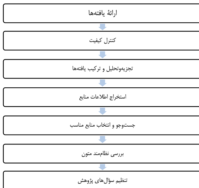
شکل ۱. الگوی هفت مرحله‌ای فراترکیب

در پژوهش حاضر به منظور شناسایی محرک‌های افشای استراتژی گزارش‌های سالانه، از روش هفت مرحله‌ای سندلوسکی و باروسو ۱ (۲۰۰۷) برای انجام تحقیق استفاده می‌شود که این مراحل عبارت‌اند از: بیان مسئله اصلی پژوهش، بررسی نظام‌مند متون، جست‌وجو و انتخاب مقاله‌های مناسب، استخراج اطلاعات از مقاله، تجزیه و تحلیل و ترکیب یافته‌ها، کنترل کیفیت و ارائه نتایج.