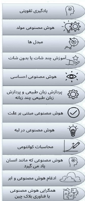
شکل ۲. روندهای فناوری هوش مصنوعی در صنعت رسانه