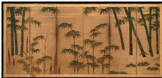
تصویر ۶. بامبو در اثر چهار فصل، توسا میتسانوبو، جوهر، رنگ و ورق طلا روی کاغذ، اوایل قرن ۱۶.