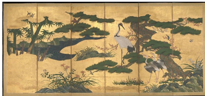
تصویر ۵. پرندگان و گل‌های چهارفصل، هنرمند ناشناس ژاپنی، جوهر، رنگ و ورق طلا روی کاغذ، اواخر قرن ۱۶.