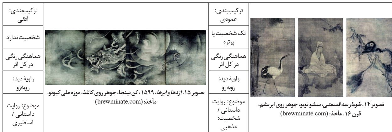
جدول ۲. مقایسه ویژگی‌های هنر ذن ژاپن و ویژگی‌های نقاشی دوره آشیکاگا

تعداد شخصیت‌های زیاد وجود دارد. در بقیه موارد، موضوعات منظره و طبیعت (۵۳ درصد) یا حیوانات (۴۶ درصد) را شامل می‌شوند. افزایش علاقه نسبت به موضوعات طبیعی و حیوانات، به کاهش روایت انسانی و داستانی منجر شده است. البته در معدود موارد، روایت با موضوع مذهبی نیز دیده می‌شود. به دلیل کاهش روایت داستانی، تقریباً در تمامی موارد، زاویه دید از روبه‌رو است. این زاویه، برای ترسیم حیوانات و موضوعات طبیعی که در زوایای بسته‌ای هستند، بهترین زاویه محسوب می‌شود. کاهش علاقه به موضوعات مذهبی را می‌توان در میزان فراوانی انواع شخصیت‌های انسانی نیز مشاهده کرد. بدین ترتیب، بیشتر از شخصیت‌های معمولی در این آثار استفاده شده است. جدول (۲)، ویژگی‌های ذن و نقاشی آشیکاگا در کنار هم نشان می‌دهد.