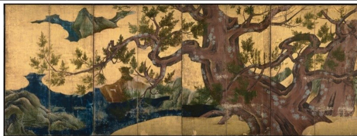
تصویر ۴. نقاشی هشت‌لته‌ای درختان سرو، کانو ایتوکو، جوهر، رنگ و ورق طلا روی کاغذ، با ابعاد ۱۷۴/۶۱ (متر، موزه ملی توکیو.)

نقاشی‌های بعدی است. تصاویر (۴-۵)، مربوط به نقاشی طبیعت است. رنگ‌های درخشان، طرح‌های جوهر قوی، پس‌زمینه ورق طلا و انبوه عناصر تصویری، نمونه‌ای از فرمول تزئینی است که توسط کانو موتونوبو (۱۴۷۶-۱۵۵۹)، بنیان‌گذار مکتب کانو، ایجاد شد. ابعاد اغراق‌آمیز درختان کاج و سرو، تلاش برای ایجاد فضایی برای برجسته‌کردن شاخه‌ها در ترکیبی شلوغ و به‌تصویر کشیدن پرچین‌های چوب است. این پرده‌ها در عظمت ظریف خود، منعکس‌کننده فضای مجللی هستند که در عمارت‌ها و معابد پایتخت وجود داشته است. ترکیب فضای مجلل در بستر طبیعت و زندگی واقعی، بیان‌گر وحدت میان انرژی‌های معنوی و تجربه