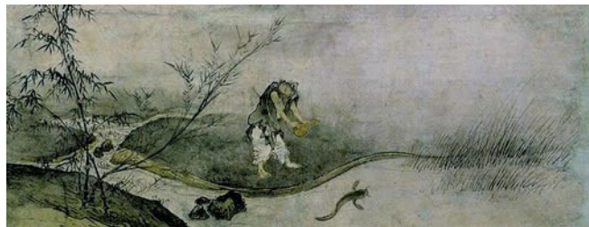
تصویر ۳. صید گربه ماهی با کدو، اوایل قرن ۱۵، جوستسو، جوهر و رنگ روی کاغذ، موزه ملی کیوتو.