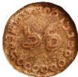
تصویر ۳. اثر مهر اول بر گِل‌مهر

ظریف‌تر متعلق به مقامات دولتی بوده و مردم عادی به مهرهایی معمولی و ساده‌تر قناعت می‌کردند (پوپ و اکرم، ۱۳۸۷: ۹۸۱؛ حصوری، ۱۳۸۱: ۱۴۸). با توجه به متن کتیبه، باید اثر مهر مورد بحث را در دسته اول، یعنی اثر مهر مقامی دیوانی / اداری قرار داد.