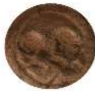
تصویر ۷. اثر مهر دوم بر گل‌مهر مرورود. Figure 7: The second seal impression.

کواذ مجدداً تحت سلطه ساسانیان قرار گرفته است. با توجه به اصلاحات گسترده اداری و دیوانی در دوره کواذ و فرزندش خسرو انوشیروان می‌توان احتمال داد در این دوره مرورود دارای مقامی با عنوان استاندار شده و مکاتبات اداری آن استان با دربار ساسانی آغاز شده باشد. بنابراین قدمت گل‌مهر مورد بحث را می‌توان مربوط به سال‌های آغازین سده ششم میلادی و همزمان با سال‌های ابتدایی در دوره دوم سلطنت کواذ (۳۵) و یا با ضریب احتمال بیشتر پس از آن و در دوره پادشاهی خسرو انوشیروان و در فاصله سال‌های ۵۷۹-۵۳۱ میلادی تعیین کرد.