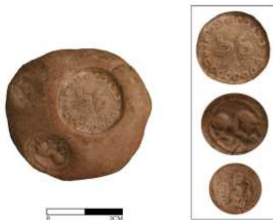
تصویر ۱. گِل مُهر ساسانی و سه اثر مُهر بر آن، / ابعاد گِل مُهر: قطر: ۳/۹ سانتی متر - ۳/۵ سانتی متر