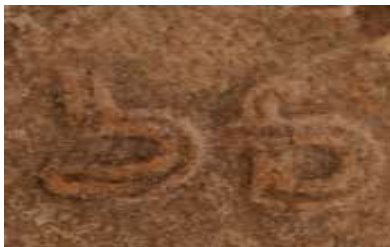
تصویر ۶: دو حرف پهلوی (م ل) در بخش مرکزی اثر مهر اول