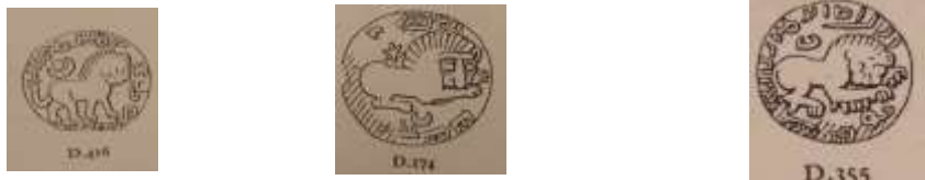
تصویر ۸. طراحی نقش شیر بر مهرها و گل‌مهرهای قصر ابونصر، برگرفته از: (Frye, 1973: D.174, D.355, D.416).