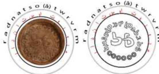
تصویر ۲: طراحی اثر مُهر اول بر گِل مُهر (طراحی از مجتبی زاده خراسانی).