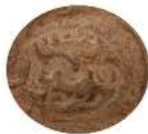
تصویر ۹. اثر مهر سوم بر گل‌مهر Figure 9: The third seal.