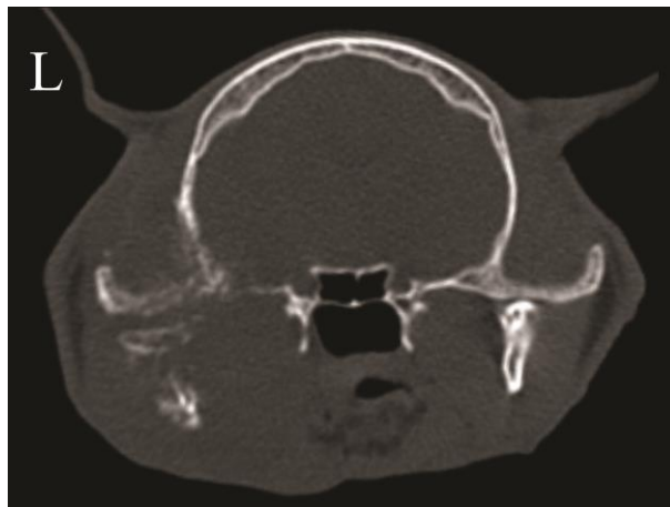
تصویر ۴. استئومیلیت مفصل فکی- گیجگاهی چپ در یک گربه. تورم بافت نرم به همراه واکنش تخریبی (لیزه‌های کانونی) و همچنین واکنش پرولیفراسیون فعال در استخوان فک پایین و استخوان گیجگاهی در سمت چپ به خوبی قابل مشاهده است.