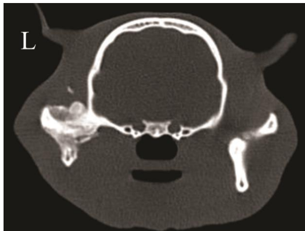
تصویر ۳. آنکیلوز مفصل فکی- گیجگاهی چپ در یک گربه. ساختار مفصلی و سطوح آن نامشخص و از بین رفته است.