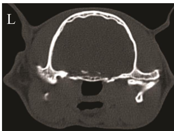
تصویر ۲. استئوآرتروز مفصل فکی-گیجگاهی در یک گربه. تنگ شدن فضای مفصلی در سطح میانی مفصل راست به همراه تغییرات دژنراتیو کندیل فک پایین و اسکروتیک شدن استخوان زیر غضروف و همچنین تغییر شکل (remodeling) سطح جانبی مفصل دیده می‌شود.

در مطالعه حاضر شکستگی در TMJها به صورت مجزا و همچنین همراه با سایر عوارض و بیشتر با عارضه دررفتگی مشاهده شد. همچنین نتایج نشان داد که دررفتگی کامل و ناقص اغلب همزمان با شکستگی اتفاق افتاده است. دررفتگی کامل همراه با عارضه آنکیلوز و دررفتگی ناقص همراه با استئوآرتروز و استئوکندروز نیز مشاهده شد. عارضه استئوآرتروز به تنهایی یا همراه با عارضه شکستگی، دررفتگی ناقص، آنکیلوز و استئوکندروز مشاهده شدند. عارضه آنکیلوز در یک گربه به صورت مجزا در هر دو مفصل و در سایر گربه‌ها همراه با عارضه استئوآرتروز، شکستگی و عارضه دررفتگی کامل رخ داده و در یک قلاده سگ نیز این عارضه همراه با شکستگی دیده شد. استئوکندروز به شکل مجزا از سایر عوارض و به صورت دوطرفه در یک مورد سگ رخ داده و همراه با سایر عوارض مثل استئوآرتروز، شکستگی و دررفتگی ناقص در سایر سگ‌ها دیده شد. همچنین دیسپلازی فقط در یک قلاده سگ به صورت مجزا و دوطرفه دیده شد. استئومیلیت نیز در یک مورد گربه همزمان با شکستگی کندیل فک پایین مشاهده شد. تصاویر عرضی سی‌تی‌اسکن از مفاصل فکی-گیجگاهی که با عوارض شکستگی، دررفتگی، استئوآرتروز، آنکیلوز و استئومیلیت درگیر بوده‌اند در تصاویر ۱،۲،۳،۴ آورده شده‌اند.