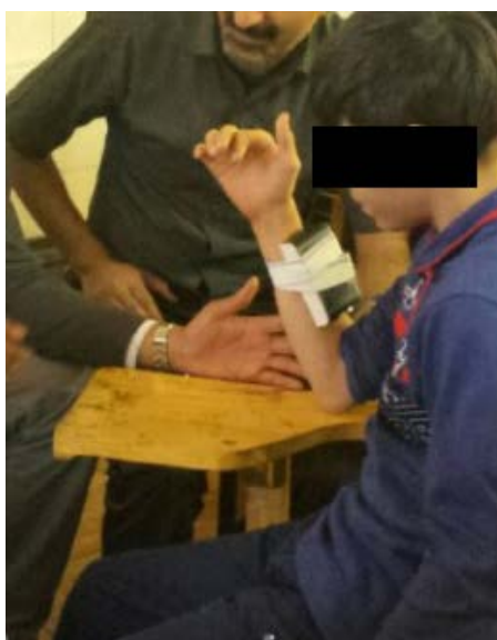
شکل ۲. اجرای تکلیف حس عمقی توسط شرکت کننده