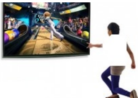
شکل ۳. تصویر شماتیک پرتاب بولینگ در بازی Xbox

به منظور انجام تمرینات واقعیت مجازی از دستگاه Xbox استفاده می‌شود. این دستگاه دارای رزولوشن تصویر ۱۹۲۰×۱۰۸۰، و مجهز به ۵ پورت USB (Universal Serial Bus)، یک پورت مخصوص Kinect، خروجی‌های HDMI و AV، خروجی TOSLINK و همچنین شبکه بی‌سیم Wi-Fi بود.