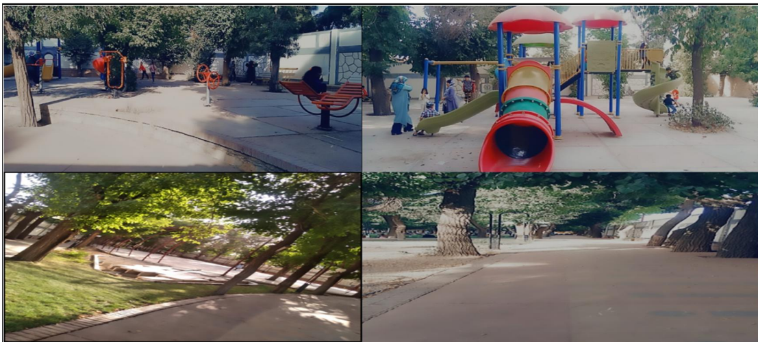
شکل ۴. تصاویری از پارک بانوان لاله