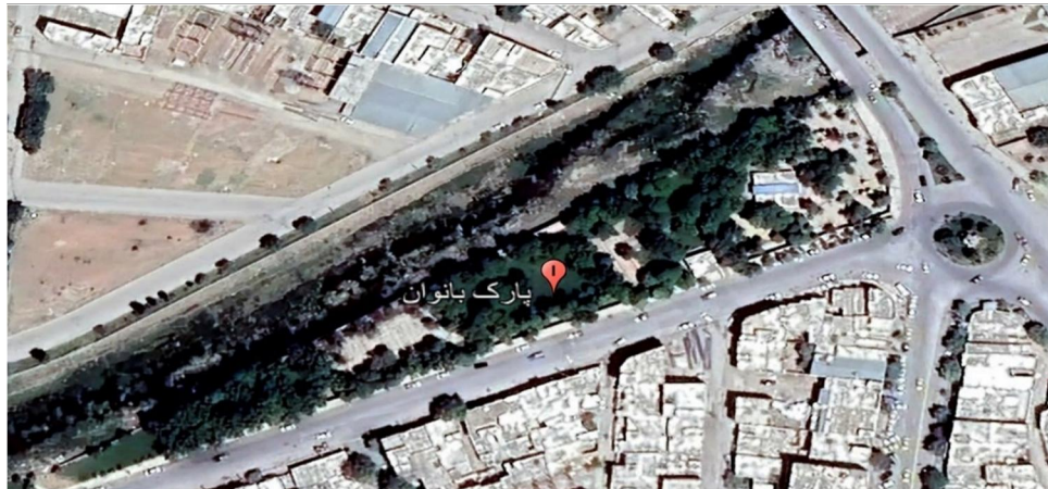
شکل ۳. موقعیت جغرافیایی پارک بانوان لاله