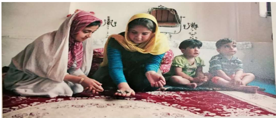
تصویر ۶. بازی بَشِ دَاشِ، موزه مردم‌شناسی، اورمیه، تابستان.

روی دیوار موزه تابلوی است که در آن تصویر تعدادی دختر جوان و نوجوان مشغول بازی «بَشِ دَاشِ» یا (پنج سنگ) هستند، دیده می‌شود. بازی «بَشِ دَاشِ» بیشتر بازی دختران جوان و نوجوانان بوده و برخی مواقع پسران نوجوان نیز این بازی را انجام می‌دهند.