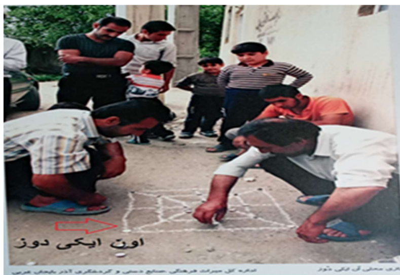
تصویر ۵. بازی اون ایکی دوز، موزه مردم شناسی، ارومیه، تابستان.

قوانین بازی مانند اوچ دوز (سه بچین) بوده با این تفاوت که تعداد مهره ها، نقاط، خطوط و تقاطع صفحه‌ا میدان بازی بیشتر است و مکانی در وسط شکل وجود دارد که مهره های حریف را پس از خارج کردن از مسیر بازی، در آنجا می گذارند. در این بازی طرفین به نوبت مهره های ۳ یا ۱۱ تایی خود را بر روی صفحه و در تقاطع خطوط گذاشته و می کوشند تا سه تا سه تا مهره های خود را در یک ردیف بچینند و در عین حال از پیش آمدن این حالت برای حریف نیز جلوگیری کنند. اگر یکی از بازیکنان موفق به اینکار شود، یکی از مهره های حریف را به دلخواه و با این قصد که مانع ردیف شدن سه تایی مهره های اوست، برمی دارد و کنار می گذارد. زمانی که مهره ها چیده شد و هیچکدام موفق به چیدن سه مهره در یک ردیف نبود، بازی وارد مرحله دوم می شود. در این مرحله هریک از بازیکنان مهره های خود را یک خانه می تواند جابجا کنند. از نظر تقسیم جنسی و سنی هر دو گروه مرد و زن، دختر و پسر می توانند این بازی را انجام دهند، اما در کل این بازی مختص مردان جوان و میانسال و کهنسال بوده و در بیرون از خانه انجام می شود.