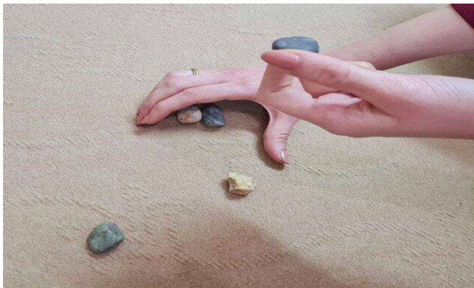
تصویر ۷. بازی بش داش، موزه مردمشناسی، اورمیه، تابستان