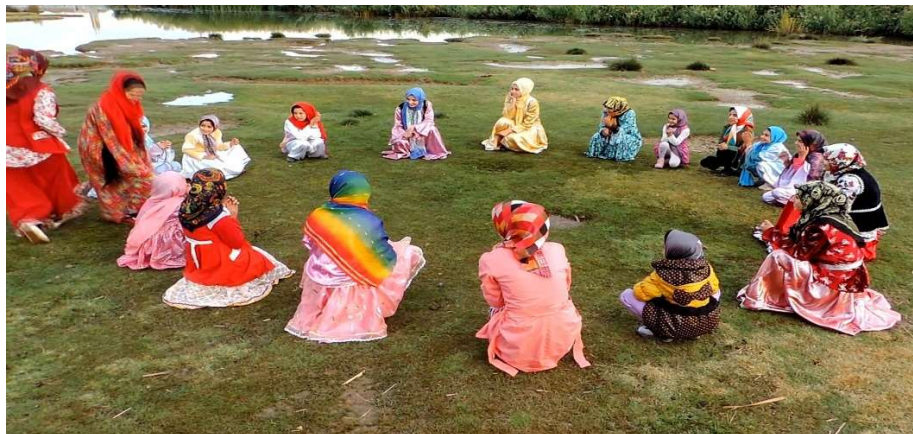
تصویر ۳. بازی محلی بنوشه، موزه مردمشناسی، ارومیه، بهار.

وسایل مورد نیاز بازی: دو دسته ۵-۶ تایی از افراد مقابل هم.