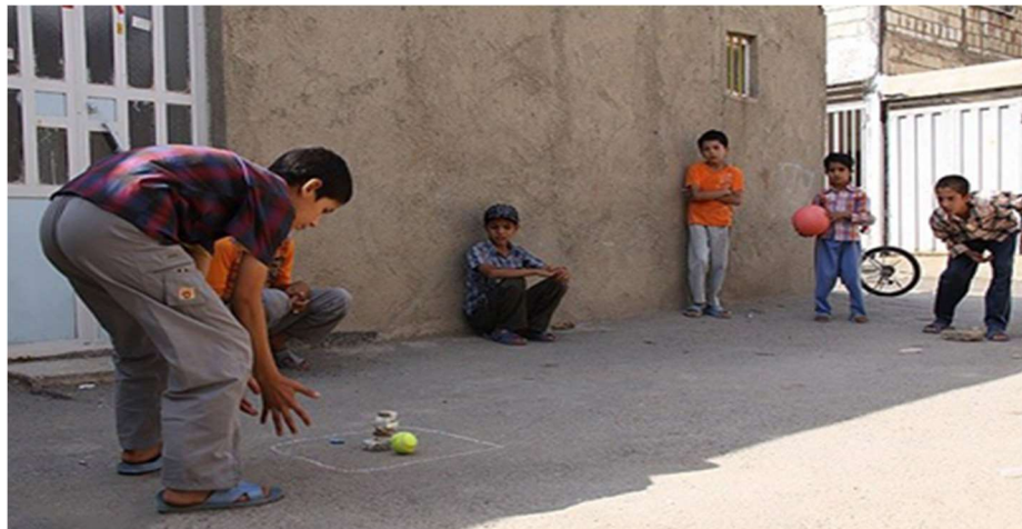
تصویر ۴. بازی یئندی داش، موزه مردم شناسی، ارومیه، تابستان