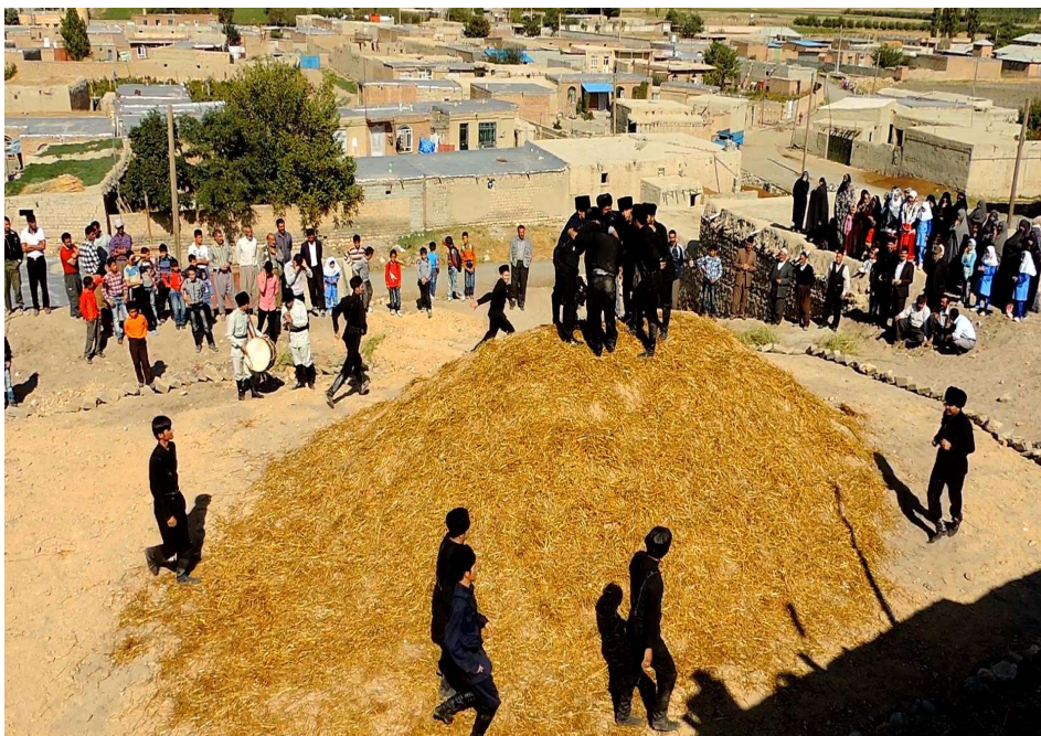
تصویر ۲. بازی قالا تودو، روستای اسلام آباد، ارومیه، تابستان.

وسایل مورد نیاز بازی قالا تودو: زمین نسبتاً مرتفع، دو گروه ۴-۵ نفره؛ اولی جهت محافظت از قلعه و دومی هم برای