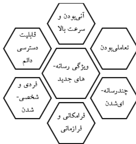
شکل (۱): ویژگی‌های رسانه‌های جدید (برگرفته از عطاران و برزویی، ۱۳۹۷)

اشکال نوین ارتباطی، و ایجاد مراجع جدید هویت، موجب پیدایش ذهنیت‌های ناپایدار، و هویت‌های جدید شده است. در جوامع امروزی بر اثر تحولات ساختاری ناشی از این انقلاب ذهنیت و هویت ناپایدار شکل می‌گیرد و برداشت انسان‌ها از مفاهیم مختلف زندگی دگرگون می‌شود (احمدی و دیگران، ۱۳۹۱: ۱۷). به‌علاوه، فاوا دگرگونی بنیادینی را در ساختار تعاملات و ارتباطات انسانی ایجاد کرده است. پیامد این امر، شکل‌گیری نوع جدیدی از تعاملات انسانی است که امکان ارتباطات انسانی را فراتر از زمان و مکان گسترش می‌دهد و سبب به‌وجود آمدن شبکه‌های اجتماعی مجازی می‌گردد (اخوان ملایری و دیگران، ۱۳۹۳: ۵). شبکه‌های اجتماعی مجازی به‌واسطه توانشان در ایجاد ارتباطات سریع همزمان و ناهمزمان و دسترس‌پذیر کردن حجم انبوهی از اطلاعات، نفوذ گسترده‌ای در زیست‌جهان‌های کاربران پیدا کرده‌اند. ابعاد این تأثیرگذاری امروزه وسعتی جهان‌شمول دارد، به‌طوری‌که از هر ده کاربر اینترنت در جهان، شش نفر از شبکه‌های اجتماعی بازدید می‌کنند. در چند سال اخیر با ظهور شبکه‌های اجتماعی مبتنی بر تلفن همراه دسترسی به فضاهای مجازی آسان‌تر شده است (محمدی و دیگران، ۱۳۹۵: ۶۰). اهم ویژگی‌های رسانه‌های نوین در شکل (۱) به‌تصویر کشیده شده است.