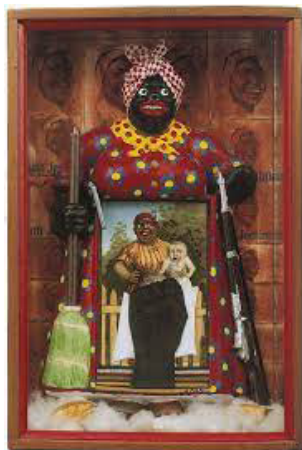
شکل ۳. بتی سار، آزادسازی عمه جمیما، ۱۹۷۲

بند و روسری (یادآور یک خانم آشپز یا نظافتچی) بود. عمه جمیما "اصلی" که از او به عنوان مدل لوگو استفاده شد، در واقع نانسی گرین ۲۸ ، یک برده آفریقایی-آمریکایی متولد ۱۸۳۴ بود. در مقابل تصاویر متعدد این لوگو، سار یک عمه جمیما عروسکی قرار داد، که زیر سینه‌های بزرگش تابلوی نقاشی دیگری از همان فیگور قرار داشت. دومی یک نوزاد سفید رنگ را بغل می‌کند در حالی که ظاهراً تلاش می‌کند لباس‌ها را بشوید و بردگی زنان سیاه‌پوست را به یاد بیاورد که بار مراقبت از خانواده اربابان سفیدپوستشان را بر دوش می‌کشند و در عین حال به عنوان دارایی آن‌ها نیز در نظر گرفته می‌شوند (Lopez and Roth, 1994, 146).