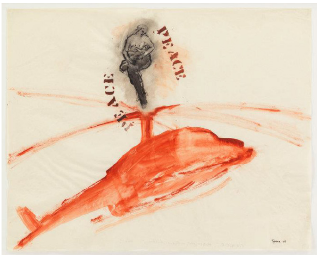
شکل ۱. نانسی اسپرو، صلح: هلیکوپتر، مادر و فرزند، ۱۹۶۸

شده، عکس‌های قدیمی، و نقاشی‌های باستانی تکمیل شده، نشان داد. اسپرو خشونت وحشیانه را از طریق ضربات قلم مو ظریف و مینیمالیستی، از جمله در مجموعه جنگ ۶ (۱۹۶۶-۱۹۷۰)، نمایش داد. یکی از تصاویر متداول در کار او هلیکوپتر بود (که در ذهنیت آمریکایی‌ها به عنوان نمادی از جنگ ویتنام حک شده) که در کنار آتش و تجاوز جنسی ظاهر شد. اسپرو به دوگانگی جنسیت و قدرت و اثر مخرب و سرکوب‌کننده ای که این ترکیب کشنده بر زنان در سراسر جهان اعمال می‌کند، پرداخت؛ برای مثال، مرد بمبی ۷ (۱۹۶۶)، موجود نر دو سری را نشان می‌دهد که در حالت نعوظ، از دهانش آتش می‌ریزد. اسپرو دربارهٔ یکصد و پنجاه طراحی روی این موضوع نوشت: "من این آثار را مانیفست‌هایی علیه تهاجم ما (ایالات متحده) به داخل ویتنام تصور می‌کردم، تلاش شخصی برای طرد روح پلید. بمب‌ها فالیک و زشت هستند، نمایش جنسی اغراق آمیز آلت تناسلی: سرهایی با زبان‌های چسبیده، بازنمایی خشن از بدن انسان (بیشتر مرد). ابرهایی از بمب پر از سرهای فریاد زده، استفرغ سم بر روی قربانیان زیر و غیره" ۸ (Spero, 1996, 124).