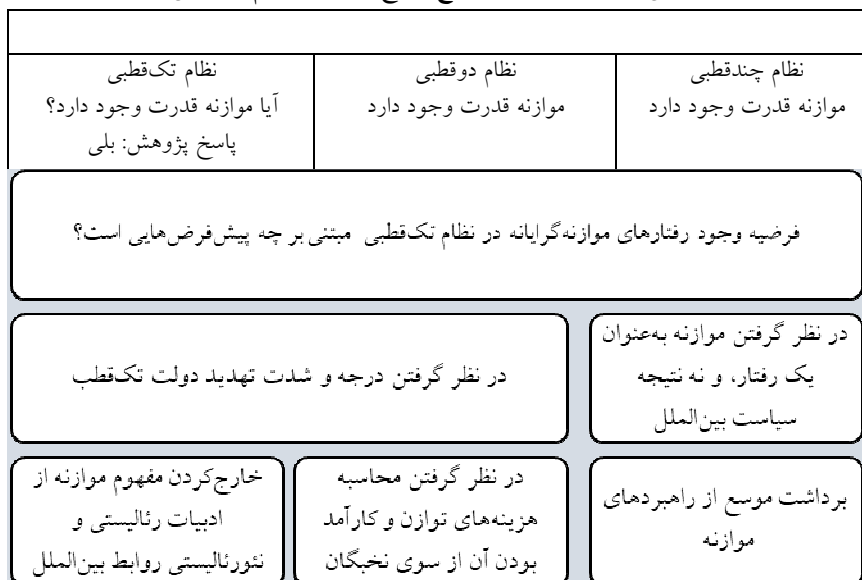
شکل ۳. فرایند موازنه در انواع توزیع قدرت در نظام بین‌الملل