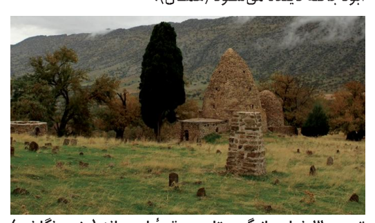
تصویر ۳: نمایی از گورستان و مقبرهٔ ابودجانه

در تذکیرهٔ وی چنیین نوشتهاند که ابودجانه انصاری یا «سیماك بین خرشه» از طایفهٔ «اوس» از نزدیکان «سعد بین عباده»، از بزرگان صحابه و دلاوران عبرب، بود. وی در جنگ «بدر» و «احد» و دیگر غزوات نبی اکرم (ص) حاضر بوده است (گلزاری و جلیلی، ۱۳۴۷؛ ۱۴۵۰).