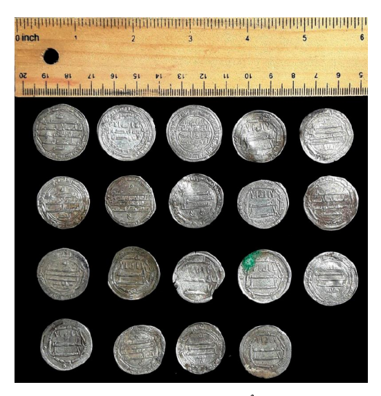
تصویر ۶: تصویری کُلی از سکههای کشفشده. منبع: نگارندگان

1975 .Qaleh-I Yazdgird: First season of Excavation,1975. in Proceeding of the Fourth Annual Sympusium on archaeological Research in Iran (November1975). Tehran: Iranian Center for Archaeological Research. 390-380. Keall, E.J. 1977 .Qaleh-I Yazdigird: The Question of its Date. IRAN 20-1:15.