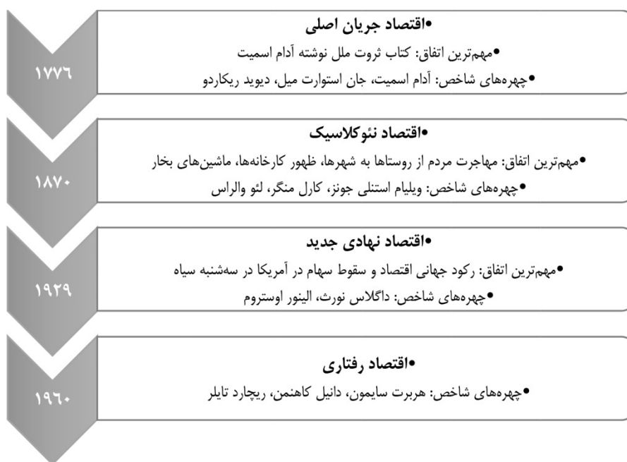
شکل ۱. سیر تحول مکاتب اقتصادی در طول تاریخ

افراد در عمل، به دلیل محدودیت دانش خود، در انتخاب‌هایشان به تصمیم‌گیری‌های رضایت‌بخش بسنده می‌کنند. همچنین اقتصاددانان رفتاری، مفروضات نئوکلاسیک‌ها را درباره پایداری و سازگاری ترجیحات و اولویت‌های فردی و استقلال آن‌ها از متغیرهای محیطی، از جمله اجتماع و رسانه‌ها و... مورد نقد قرار دادند (هاوسمن و مک پیرسون، ۲۰۰۶؛ انگلن، ۲۰۰۵؛ الستر، ۲۰۰۹). باور آن‌ها چنین است که ترجیحات افراد در طول زمان تغییر می‌کند و سلیقه افراد تحت شرایط و عوامل گوناگون متفاوت و گاه متضاد است. از این رو، تبیین چگونگی شکل‌گیری اولویت‌های تصمیم‌گیری افراد به اقتصاددانان کمک می‌کند که از عوامل تعیین‌کننده اولویت‌های فردی درک درستی را به دست آورند (آلتمن، ۱۳۹۷). هرچند اقتصاد رفتاری نقدهای زیادی بر اقتصاد نئوکلاسیک دارد؛ اما به‌طور کامل دستاوردهای آن را کنار نگذاشته است. تمرکز اقتصاد رفتاری بر ساختن یک علم اقتصاد کاربردی، دقیق و واقع‌گرایانه‌تر بر پایه همان پیش‌فرض‌های اقتصاد نئوکلاسیک است (کامرر، لونسیتین و رایین، ۲۰۰۴؛ هو و کامرر، ۲۰۰۶) (شکل ۱).