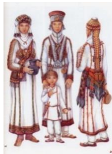
شکل ۲. پیراهن و کلاه زنانه منطقه ولگا بلغار که با آویزهای مختلف فلزی، سکه‌ها و... تزئین می‌شود