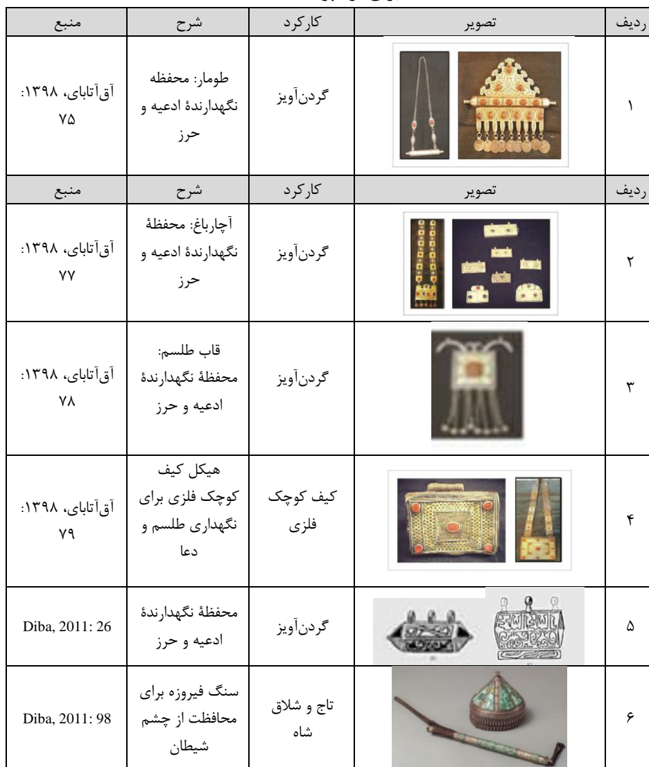
جدول ۱. برخی زیورآلات زنان و مردان ترک و ترکمن که نشان‌دهنده کارکرد حفاظتی اشیا برای فرد پوشنده هستند