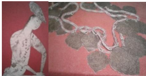
شکل ۱. سمت راست، بخشی از مینیاتور دوره صفوی جوانی با چهل بسم‌الله

وجود داشت، سکه‌ها و فلزاتی که به نقش پرنده‌گان قدرتمند شکاری مزین شده بودند، برای اتصال به لباس انتخاب می‌شدند. در حکومت صفوی نیز این رسم میان زنان ایرانی به نشانه‌ حمایت از آداب و رسوم ترکان یا به دلیل کسب قدرت‌های ماورایی و جنبه‌ حفاظتی که با صدای برخورد سکه‌ها ایجاد می‌شد امتداد یافته است که با توجه به شواهد احتمال رواج به دلایل ماورایی بیشتر است؛ زیرا در این دوره و در میان زیورآلات صفویه شاهد ورود عناصری هستیم که به لحاظ فرم قرارگیری روی بدن مانند زیورآلات ترکی و از نظر محتوا و شیوه کارکرد می‌توان گفت تحت تأثیر صوفیان و دراویش قزل‌باش هستند و حتی در مینیاتورها نیز منعکس شده‌اند؛ مانند آویز چهل بسم‌الله که جنبه‌ تقدس دارد و ممکن است برای حفظ فرد از شر نیروهای منفی ابداع و استفاده شده باشد؛ هم به دلیل تقدس عدد چهل در میان دراویش و هم از نظر قداست کلام. «در یک مینیاتور جوانی علاوه بر گوشواره زنجیر یا نواری با آویزهایی به شکل ازگیل با نقش چهل بسم‌الله دارد که از شانه‌ چپ به پهلو راست حمایل شده، این‌طور به نظر می‌آید که مرد از اشراف دربار و سقایی با این تعویذ است» (غیبی، ۱۳۹۱: ۲۹۴).