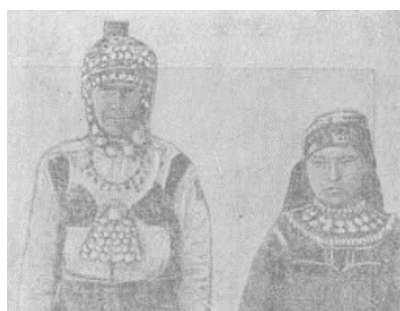
شکل ۳. زن و دختر چوواش با پوشش سکه‌دوزی شده (منطقه چیستوپولسکی استان کازان)

لباس‌های ترکان علاوه بر هدف محافظتی دارای کارکردهای نمادین و آیینی بود (ذابح و حاتم، ۱۳۹۲: ۶۹). انسان به مرور یاد گرفت از لباس برای خود حفاظتی به منظور عوامل نامرئی و ماورایی بسازد، از اشکالی که در اطراف می‌دید برای الگوگرفتن بهره برد و به مدد تزئینات و متصل کردن آرایه‌هایی به پوشش خود با اطراف و عوامل طبیعی ارتباط برقرار کند (Toph, 1960: 3). مانند پوشش زنان چوواش که روپوشی زینت‌یافته با مدال‌های فلزی، سکه و مهره‌های سنگی بود و سرپوش آنان اغلب مهره‌دوزی می‌شد تا از خاصیت‌های سنگ‌ها نیز بهره کافی ببرند (تارنمای شماره ۸).