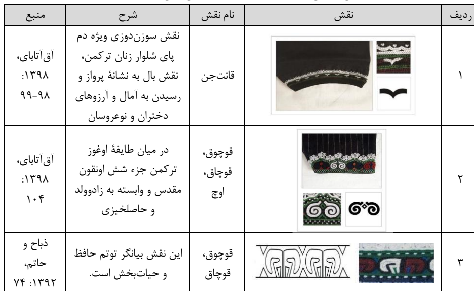
جدول ۲. بررسی برخی نقوش سوزن‌دوزی و قالی‌بافی زنان ترکمن و مفهوم آن