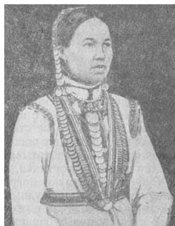
شکل ۴. زنی از کوهستان ماری استان کازان با آذین‌های سکه در سر و سینه

تیلور اعتقادات چوواش در تفاوت پوشش زنان و دختران آنان به خوبی دیده می‌شود. در شکل ۳ شخصی که در سمت راست قرار دارد، برای آذین لباس خود از سکه‌های کمتری در مقایسه با فرد سمت چپ بهره برده است. دختران چوواش در ساخت لباس‌های خود از برش‌های کمی استفاده می‌کنند. همچنین سطح گلدوزی‌شده کمتری را در لباس‌های خود به کار می‌برند (همان: ۳۶).