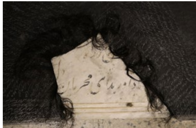
تصویر ۷: بعد از تفسیر، جزئیات چیدمان.

یعنی هرکسی به راحتی نمی‌تواند نوشته‌ها و نشانه‌ها را بخواند و دریابد که چگونه می‌توان بر قلب غالب شد و آن را به دست آورد. هدف من هم از نوشتن این متن‌ها این بود که من بنویسم و کسی نخواند؛ اما در نوشته‌هایی که در اثری با عنوان «بعد از تفسیر» کنار سنگ‌قبر آمده بودند، نوع نوشته‌ها هم متفاوت است. در بعضی از قسمت‌ها کاملاً ناخوانا و در برخی کمی خوش‌خط‌تر است که مخاطب بتواند بخواند و کلیدواژه‌هایی را به دست آورد (تصویر ۷ و ۸).