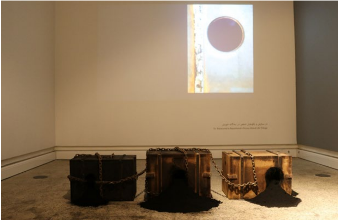
تصویر ۴. ستایش و نکوهش شخص در سه گانه خویش، از مجموعه بیخ چراغ، ۱۴۰۱، هنر چیدمان (ویدئو به همراه صوت).

می‌بیند، تنها کمکی که می‌توانم کنم این است که باید به نشانه‌ها توجه کرد و کنارهم قرار گرفتن اشکال و احجام معناساز هستند. البته این موضوع به دانش تصویری اندکی هم نیاز دارد که ممکن است مخاطبی نتواند درکش کند که من کاملاً حق هم می‌دهم، اما برای خوانش و تحلیل این کارها، اطلاع از دانش‌های مرتبط هم مفید خواهد بود (تصویر ۴).