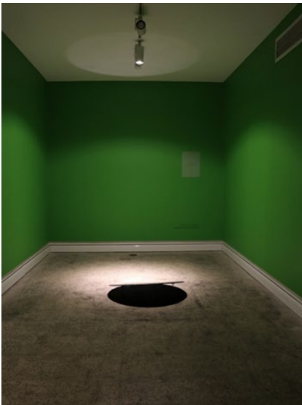
تصویر ۵. در پشت و بین دو کتف، از مجموعه بیخ چراغ، ۱۴۰۱، هنر چیدمان.

آب دارد. در واقع برچسب رنج کشیدن برای من مهم بود، وگرنه من می‌توانستم تنها تعدادی عکس را ارائه دهم. غیائی: متن‌هایی که روی کارها آورده شده بود، خوانا نبودند و به‌گونه‌ای حالت سحر و جادو هم داشتند. شما چنین هدفی داشتید؟ و به‌طور کلی در مورد اینکه متن‌ها چه موضوعاتی داشتند بگوئید.