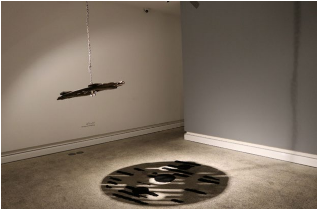
تصویر ۲. کژتابی واژگون، از مجموعه بیخ چراغ، ۱۴۰۱، هنر چیدمان.

بنیان خانواده اهمیت بسیار زیادی دارد. مادرم می‌گفت این کارهایی که به نمایشگاه می‌بری را دیگر به خانه برنگردان. درحالی‌که همه این‌ها دوباره برگشتند و در جای خود قرار گرفتند. مثلاً یک زنجیر قبلاً زنجیر بود و اکنون هم همان زنجیر است و ممکن است من در آینده از آن استفاده کنم. به عبارت دیگر در آثار من، چیزهایی را داریم که دوره‌ای کاربری خاصی داشتند، آواها و داستان‌های زیادی شنیدند و از سر گذرانده‌اند. من به عنوان یک هنرمند از آن‌ها همان‌طور که بودند استفاده کرده‌ام. مثلاً در یکی از آثارم، از دیوارهای پیش‌ساخته‌ای استفاده کردم که برای دیگران شیء دورریزی شده بود و درواقع می‌خواستند گم شود؛ اما من باز هم وارد عمل شدم و آن‌ها را درست به همان صورت که بودند، با همه احساسات و عواملی که در آن‌ها دخیل بود، با خود آوردم و همان را تبدیل به کار خود کردم و در حال حاضر هم بازگشته و تبدیل به همان چیزی شده که از اول بوده و من ممکن است از آن برای کاربری‌های مختلف دیگری هم در آینده استفاده کنم؛ یعنی من به این فکر نکردم که چون به عنوان هنرمند آن را پیدا کردم، پس یک اثر هنری است. درواقع من در مقطع خاصی، موقعیت یک