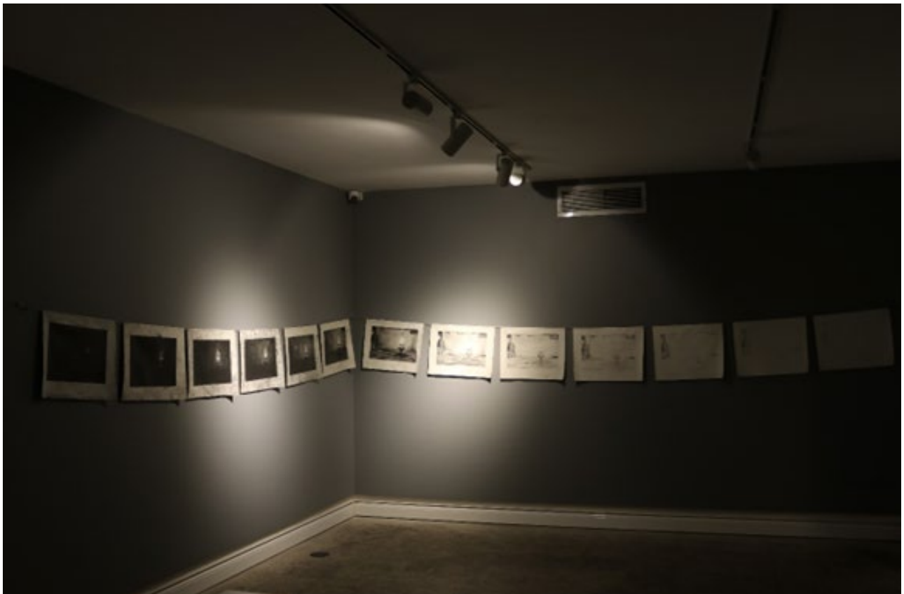
تصویر ۳. توهم ادراک، از مجموعه بیخ چراغ، طراحی بر روی پارچه متقال، ۱۴۰۱/۱۴۰۰، هنر چیدمان.

و بالا آمد. در آن لحظه بود که این ایده شکل گرفت. زمانی که من می‌خواستم همه این داستان‌ها را کنار هم بچینم و به خلق مفهوم فکر می‌کردم، ذهنم قفل بود، چراکه حال خوبی نداشتم. بعد من زمانی که این کار را انجام دادم، مانند بیماری بودم که در بستر بیماری یا حتی مرگ است، اما همچنان فکر می‌کند و دست از چیزی نشسته است و سعی می‌کند آخرین تلاش‌های خود را حتی اگر تنها تلاش برای ترسیم یک خط باشد، انجام دهد. این آثار در همان لحظات خلق شده‌اند. ابتدا با همان طراحی‌ها شروع شد. در دوره‌ای که قطعی برق را زیاد تجربه می‌کردیم، روزی در کارگاه خود نشسته بودم. کارگاه من گونه‌ای است که حتماً باید برق باشد تا روشن شود. هنگامی که دیدم قطعی پشت سرهم برق در انجام کارهایم خلل ایجاد می‌کند، چراغی قدیمی در خانه پیدا کردم و به کارگاه آوردم. آن را روی میز کارم قرار دادم، اما دیدم نورش آن قدر کافی نیست که بتوانم به کارم برسم، پس با ناامیدی تصمیم گرفتم فقط منتظر بمانم و در این حالت به این تاریکی و چراغ نگاه می‌کردم و به این می‌اندیشیدم که کجای این وضعیت نور به خود من نزدیک‌تر است؟ در تیره‌ترین نقطه تاریکی قرار گرفته‌ام