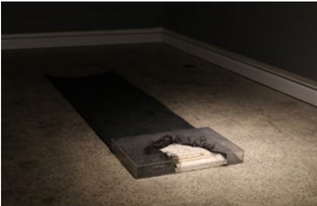
تصویر ۸: بعد از تفسیر، از مجموعه بیخ چراغ، ۱۴۰۱، هنر چیدمان.