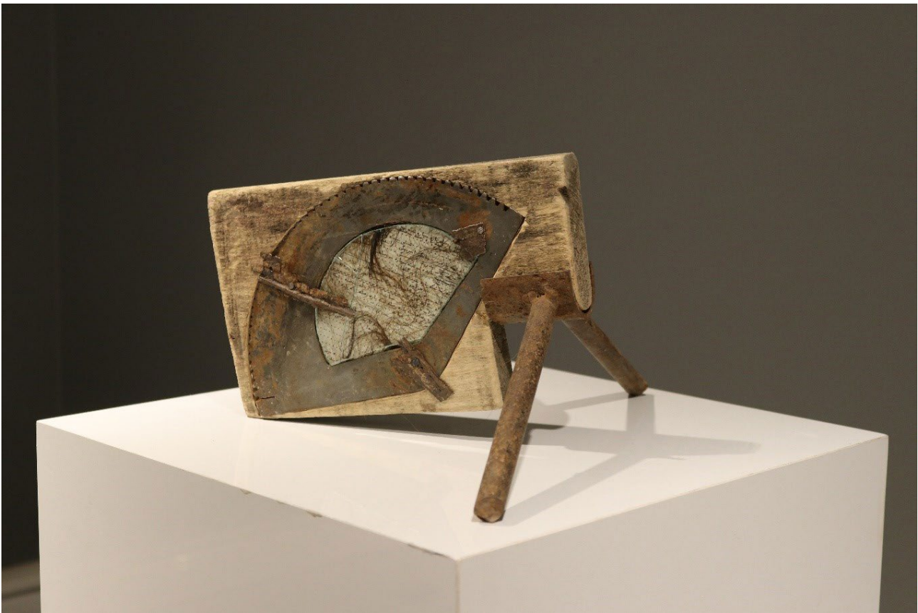
تصویر ۱. پرگاله، از مجموعه «هر آنچه هست»، ۱۴۰۰، ۱۹×۲۸×۳۶ سانتی‌متر.

غیائی: با این جمله موافقم و من هم فکر می‌کنم هر کدام از این دو مانند بازوهای عمل می‌کنند که هر یک بدون دیگری نمی‌توانند پتانسیلی که یک فرد دارد را بالفعل نمایند.