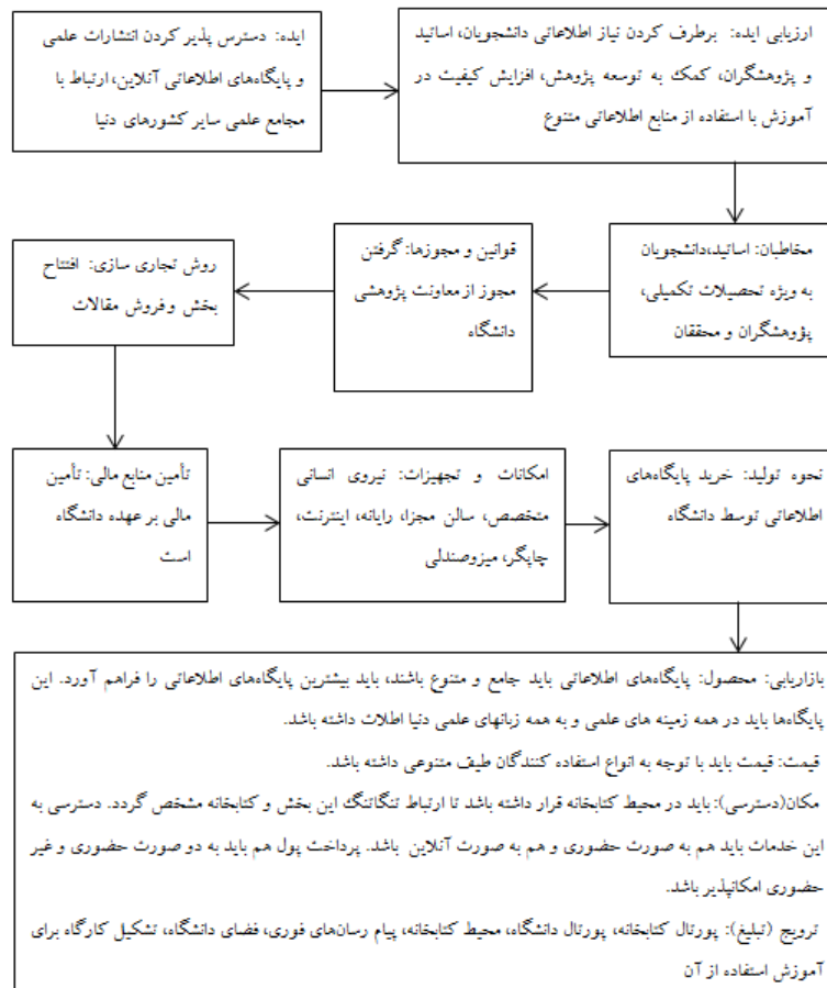
شکل ۱. پایگاه‌های اطلاعاتی، مدل مفهومی فرایند تجاری‌سازی پایگاه‌های اطلاعاتی (با تأکید بر ترتیب و توالی) کارگاه‌های آموزشی

پرسش اول پژوهش: اجزای اصلی تشکیل‌دهنده الگوی جامع تجاری‌سازی خدمات کتابخانه‌های دانشگاهی شهر کرمانشاه چه مواردی است؟ کشف(خلق) ایده، ارزیابی ایده، نحوه تولید، مخاطبان، بازاریابی، امکانات و تجهیزات، قوانین و مجوزها، تأمین منابع مالی و روش تجاری‌سازی.