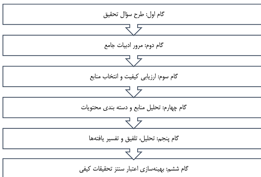
شکل ۱. مراحل انجام فراترکیب

فرایند فراترکیب، شامل گام‌های گسسته‌ای است که محقق را قادر می‌سازد تا پرسش خاص تحقیق را شناسایی کند و برای پاسخ به سؤال تحقیق، به جست‌وجو، انتخاب، ارزیابی، خلاصه‌کردن و ترکیب شواهد بپردازد (جانگوو ۱ ، ۲۰۱۰). پژوهشگران مختلف این فرایند را تا حدی متفاوت توصیف کرده‌اند؛ اما اساس آن مشابه است (اروین، برادرسون و سامرز، ۲۰۱۱). اروین، برادرسون و سامرز ۲ (۲۰۱۱) فرایند فراترکیب را در شش گام شامل طرح روشن سؤال، جست‌وجوی جامع ادبیات، ارزیابی دقیق تحقیقات برای امکان ورود به فراترکیب، انتخاب و اجرای تکنیک فراترکیب، معرفی یافته‌های سنتز مطالعات و بازتاب در فرایند تعریف می‌کنند (عابدی جعفری و امیری، ۱۳۹۸). سندلوسکی و باروسو (۲۰۰۷) نیز فرایندی پیشنهادی برای سنتز مطالعات کیفی ارائه دادند و آن را در چندین موضوع حوزه پزشکی و پرستاری پیاده کردند (سندلوسکی و باروسو ۳ ، ۲۰۰۳). نظر به جامعیت بیشتر، در این پژوهش برای ایجاد یک مدل جهت ارزیابی عملکرد مجلس، از همین روش که گام‌های آن در شکل ۱ دیده می‌شود استفاده شده است. ۴