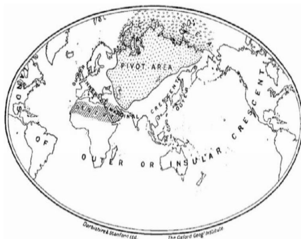
شکل شماره ۱. جهان مکیندر، منبع: (مکیندر، ۱۹۰۴: ۴۳۵)

اصطلاح در کتاب جغرافیا و قدرت جهانی استفاده کرد (فرگریو، ۱۹۱۵)، مکیندر این اصطلاح را در قالب یک نظریه نظام‌مند به کار گرفت. نگرانی او حفظ برتری سیاسی، تجاری و صنعتی امپراتوری بریتانیا در زمانی بود که فرماندهی دریاها دیگر تضمین‌کننده برتری جهانی نبود. مکیندر ظهور کشورهای بری اوراسیایی را بزرگ‌ترین تهدید برای هژمونی جهانی بریتانیا دانست (کوهن، ۲۰۱۴: ۱۷). وی با اصالت دادن به قدرت بری در سال ۱۹۱۹ عنوان داشت که هر کس بر اروپای شرقی تسلط یابد بر هارتلند نیز مسلط خواهد شد، هر کس بر هارتلند مسلط شود بر جزیره جهانی مسلط خواهد شد و هر کس بر جزیره جهانی مسلط شود بر جهان مسلط می‌شود (بالسیجر، ۲۰۱۸: ۱۲). مکیندر نگران افزایش قدرت امپراتوری آلمان در قاره اروپا در برابر بریتانیا بود (اتوتایل و همکاران، ۱۹۹۸: ۱۶؛ هاجپرگ و اسلوان، ۲۰۱۷: ۸). نظریه هارتلند وی بر لزوم ایجاد "مناطق حائل" بین روسیه و آلمان تأکید می‌کرد؛ این یک رویکرد ژئواستراتژیکی بود که بر سیاست‌های قرن بیستم تأثیر می‌گذاشت (بالسیجر، ۲۰۱۸: ۱۲). این تئوری و تئوری پرداز آن امروزه نیز اهمیت خود را از دست نداده است و عرصه سیاست بین‌الملل شاهد بازسازی تفکرات مکیندر بوده است که با افزایش مجدد علاقه به ژئوپلیتیک و هارتلند همراه بوده است (هیوز و هلی، ۲۰۱۵: ۹۰۱). نویسندگان استدلال می‌کنند که شناسایی و توصیف هارتلندها در ژئوپلیتیک معاصر، به‌عنوان یک‌راه مفید برای درک قدرت پویایی ژئوپلیتیک است. بنابراین ما ایده خود را در زمینه «ایران، هارتلند کریدوری جهان» در پس‌زمینه یک نظریه بزرگ ژئوپلیتیک که می‌تواند در قرن جدید پویایی خود را نشان دهد، ارائه می‌دهیم.