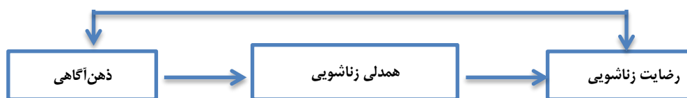
شکل ۱. مدل فرضی رابطه بین ذهن‌آگاهی و رضایت زناشویی با میانجی‌گری همدلی زناشویی

ادبیات پژوهشی گذشته، به‌طور مکرر بر اهمیت ذهن‌آگاهی در داشتن رضایت از روابط تأکید داشته است، اما جای عوامل میانجی‌گری که در این فرایند نقش ایفا می‌کنند، خالی است و توجه کمتری به آن‌ها شده است. با توجه به نقش ذهن‌آگاهی در شکل‌گیری همدلی زناشویی و از سوی دیگر، همدلی به‌عنوان عاملی که می‌تواند ارتباط بین ذهن‌آگاهی و رضایت زناشویی را تبیین کند و خلأ و کمبود تحقیقات به‌ویژه در مورد نقش همدلی زناشویی که بتواند این سازه‌ها را در ارتباط با یکدیگر بررسی کند، این پژوهش به دنبال بررسی و ارزیابی یک مدل همدلی زناشویی به‌عنوان میانجی بین ذهن‌آگاهی و رضایت زناشویی بود (شکل ۱).