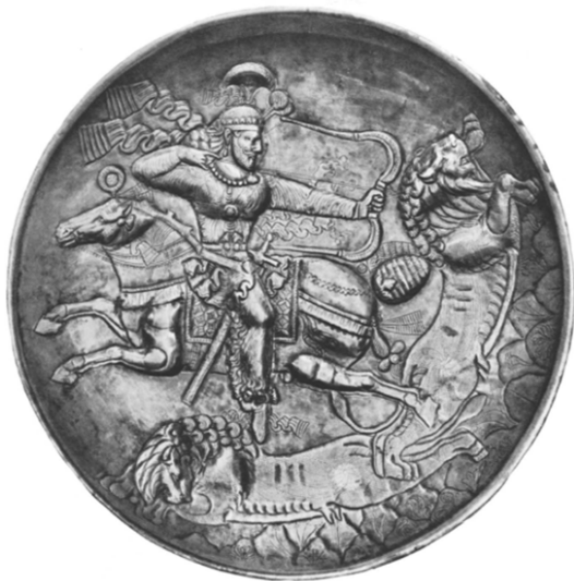
شکل ۲: بشقاب ساسانی با نقش شکار شیر (واندنبرگ، ۱۳۴۸: ۷).

علی سامی نیز او را اردشیر دوم در زمان ولیعهدی معرفی کرده است و دلیلی برای این ادعا نیاورده است (سامی ۱۳۸۸، ج ۲: ۱۲۰). واندنبرگ نیز نقش مذکور را شاهنشاه ساسانی و احتمالاً یکی از پسران شاپور دوم (شاید شاپور سوم) معرفی کرده است (واندنبرگ، ۱۳۴۸: ۷). گیرشمن در توصیف بشقاب نقره مذکور در مورد فرد نقش شده معتقد است از آنجا که پیروزی بر حیوان (شیر) امتیازی شاهانه است و نقش تاج در هیچ سکه‌ای وجود ندارد، بنابراین او را شاهزاده‌ای ساسانی معرفی می‌کند که رویای به سلطنت رسیدن دارد. او در مورد تاریخ اثر معتقد است که نیم تاج این شاهزاده شبیه نیم تاج هرمزد اول و شاپور دوم است و به این ترتیب این اثر متعلق به اواخر قرن سوم یا قرن چهارم میلادی است (گیرشمن، ۱۳۹۰: ۲۰۹).