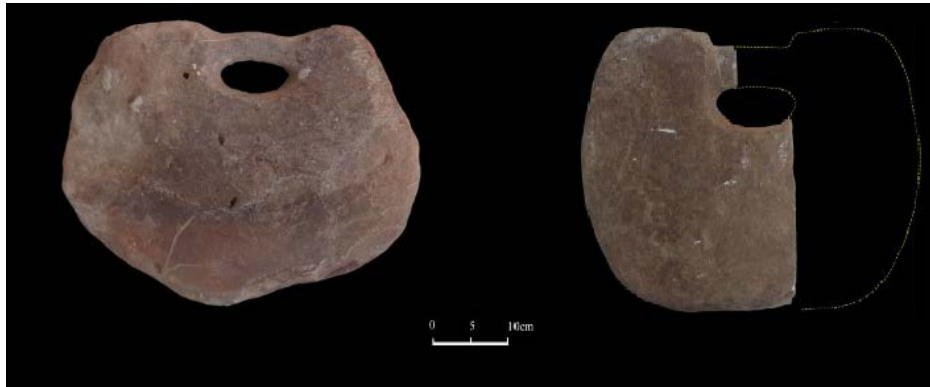
شکل ۱۰: نمونه دیسک‌های عصر مفرغ تپه چلو (عکس از وحدتی و دیگران، ۱۳۹۸ تصویر ۷؛ با اندکی تغییرات).

وزنه ثابت کند یا قابل پذیرش جلوه دهد ارائه نداده‌اند و همچنان کاربرد آنها نامشخص است. همچنان که در بالا اشاره شد نمونه‌های سنگی عصر مفرغ به لحاظ ظرافت در ساخت، ساده یا تزیین دار بودن با یکدیگر متفاوت هستند. دو قطعه از نمونه دیسک‌ها از محوطه چلو به دست آمده است. این محوطه در شرق دشت جاجرم و در ۳ کیلومتری شرق شهر سنخواست قرار دارد (وحدتی و دیگران، ۱۳۹۸: ۶۳-۷۴). این نمونه‌ها به لحاظ ظرافت و تزیین جزء نمونه‌های ساده و زمخت هستند (شکل ۱۱).