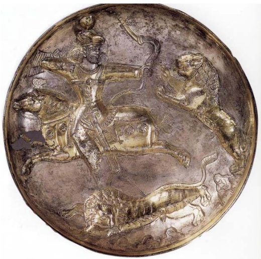
شکل ۴: بشقاب با نقش هرمزد دوم در حال شکار شیر، موزه هنر کلیولند (Harper, 1981: 215).

شکار شیر توسط شاه/شاه پهلوان در هنر خاور نزدیک نماد قدرت و از ویژگی‌های صحنه‌های شاهانه است و در ادبیات، منظومه‌ها و حماسه‌های منطقه نقشی اساسی داشته است. نمونه‌های متعددی از نمایش صحنه شکار شیر از ادوار گوناگون تاریخی در ایران و خاورمیانه بجای مانده است؛ از جمله در هنر بین‌النهرین و همچنین مجموعه تخت جمشید، آثاری با صحنه شکار شیر به دست شاه/شاه پهلوان بجای مانده که بدون شک در زمان ساسانیان بخش‌هایی از آن خارج از خاک بوده است و نشانه آن نقش و کتیبه شاپور نامی از شاهزادگان ساسانی بر کاخ تچر است. مشابه نقش این دیسک مرمری در چندین بشقاب ساسانی وجود دارد. نمونه‌های آن بشقابی از شاپور دوم در موزه ارمیتاژ روسیه (شکل ۳)، بشقاب هرمزد دوم (شکل ۴)، بشقاب اردشیر دوم در مس عینک (شکل ۵) و چند بشقاب از بهرام گور است (شکل ۶) که در آنها نیز صحنه شکار شیر بازنمایی شده است.