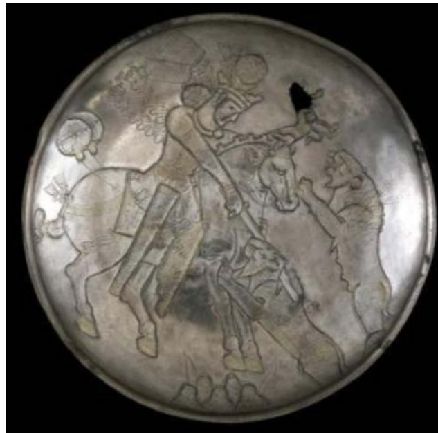
شکل ۶: بشقاب ساسانی با نقش بهرام گور در حال شکار شیر؛ محل نگهداری موزه بریتانیا (Harper, 1981: 226).