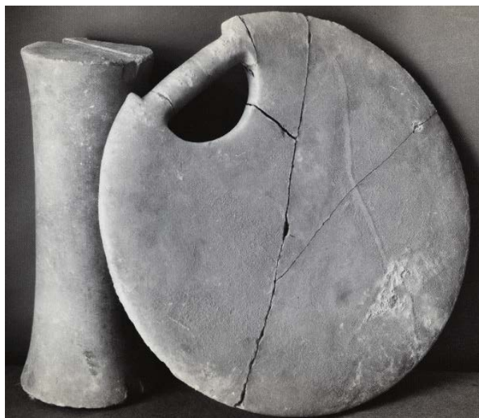
شکل ۱۳: یک صفحه سنگ مرمر به دست آمده از تپه حصار دوره IIIIC ۲۵۰۰ ق.م. (Salzman, 2007: Fig 68).

فلات ایران، زاگرس، بین‌النهرین و فراتر از آن) قرار داشته است (روستایی ۱۳۸۵: ۷). از دوره IIIIC تپه حصار گنجینه‌ای به دست آمد که در میان آن یک دیسک مرمری با شکاف دسته مانندی در بالای آن وجود داشت (شکل ۱۳). این نوع از دیسک‌ها اغلب همراه ستونی یافت شده‌اند. در بالای این ستون، شیاری ایجاد شده که ممکن است این دیسک‌ها روی این شیار قرار می‌گرفته است (Schmidt, 1937: 216-218).