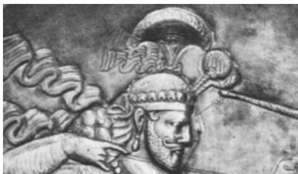
شکل ۸: نقش تاج روی بشقاب نقره ساسانی ساری (گیرشمن، ۱۳۹۰: تصویر ۲۵۰).

لحاظ تزیین متفاوت از هم هستند. تزیین بالای تاج اردشیر دوم به صورت گوی کامل است، اما تاج شاه روی پلاک سنگی همچون هلال است. تزیین گوی اردشیر دوم موج است و چه بسا بخشی از موی او باشد، اما هلال نقش شده بر تاج شاه روی پلاک سنگی در قسمت فوقانی دنداندار و همچون تشعشع خورشید به نظر می‌رسد (شکل ۷ و ۸).