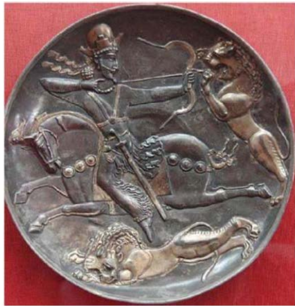
شکل ۳: بشقابی از شاپور دوم در حال شکار شیر، موزه ارمیتاژ روسیه (وئوق بابایی و مهرآفرین، ۱۳۹۴: شکل ۲).

Figure 4: Plate with the scene of Hormzad II hunting a lion, Cleveland Museum of Art (Harper, 1981: 215).