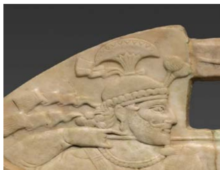
شکل ۷: نقش تاج روی سر شاه دیسک مرمری ساری (Handbook of the Cleveland Museum of Art, 1969: 13).