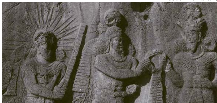
شکل ۹: نقش تاج ستانی اردشیر دوم (نفر میانی) در طاق بستان (فریه، ۱۳۷۴: شکل ۲۶).