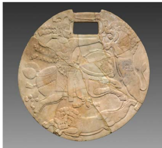
شکل ۱: دیسک ساسانی با نقش شکار شیر (Cleveland Museum of art. 1969: 13).

Figure 2: Sasanid silver plate with lion hunting scene (Vandenberghe, 1970: 7)