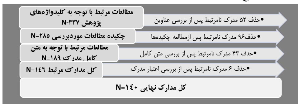
شکل ۱. فرایند نتایج جستجو و انتخاب مدارک مناسب در پژوهش حاضر

از آنجا که بسیاری از مدارک به دست آمده حاوی اطلاعات کلی در زمینه اطلاع‌رسانی مخاطرات بوده و اطلاعات مفیدی برای ایجاد مؤلفه در این حوزه ارائه نمی‌کرد، نتایج به دست آمده در این مرحله طی چند فرایند پالایش شدند تا مدارک نامرتب مشخص شوند و مدارکی که موضوع پژوهش را کامل پوشش می‌دهند به عنوان مدارک مرتبط انتخاب شوند. در شکل ۱ می‌توان خلاصه‌ای از فرایند ارائه شده را همراه با نتایج به دست آمده از پژوهش حاضر مشاهده کرد.