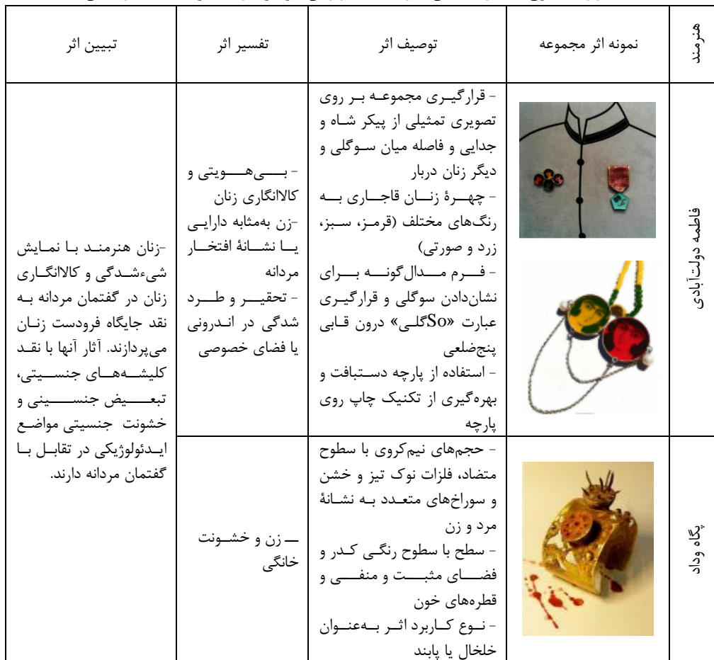
جدول ۱: سطوح تحلیل گفتمان آثار منتخب از زنان جواهرساز معاصر. مأخذ: نگارندگان.