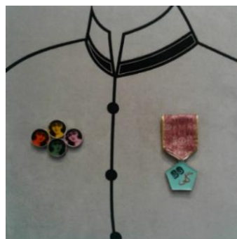
تصویر ۱. فاطمه دولت‌آبادی، گفت‌وگوی هووها پشت‌سر سوگلی دربار، ۱۳۹۶.