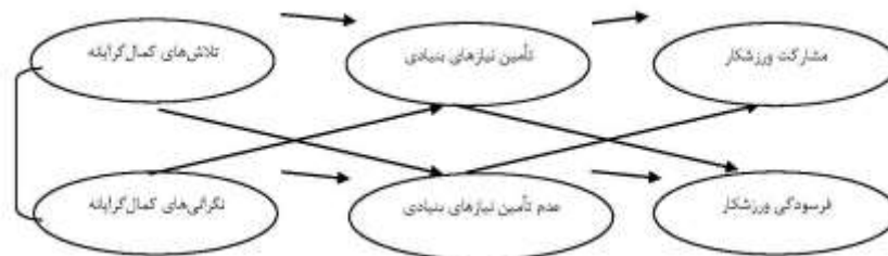
شکل ۱. چهارچوب مفهومی پژوهش

جلوگیری کند. موفقیت ورزشی نیز که معیار مهم و اصلی تمام ورزشکاران قهرمان است، می‌تواند بر اهمیت و ضرورت انجام این تحقیق بیفزاید. همچنین نتایج این تحقیق مورد استفاده مربیان و ورزشکاران و روان‌شناسان ورزشی قرار می‌گیرد.