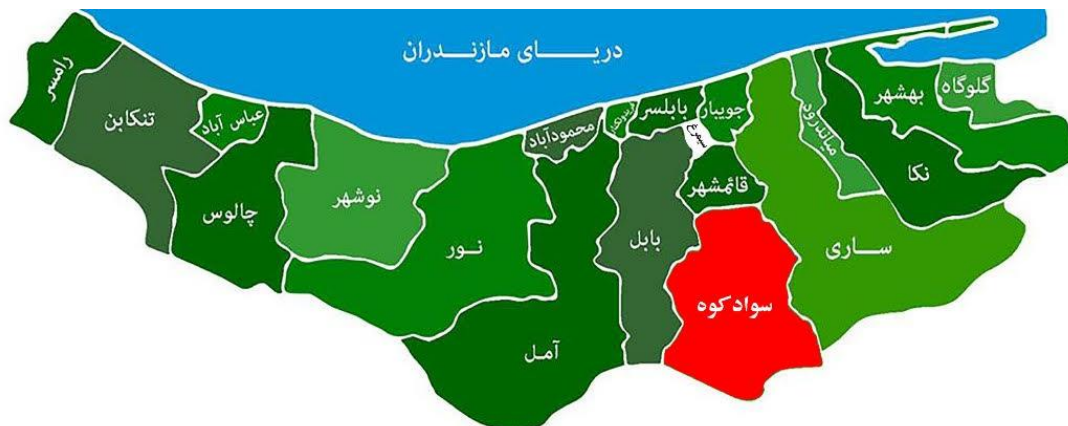
شکل ۱. موقعیت جغرافیایی شهرستان‌های سوادکوه و سیمرغ

در مطالعه حاضر بر اساس نتایج حاصله از آنالیز داده‌های در دسترس برای هر یک از شهرستان‌های استان