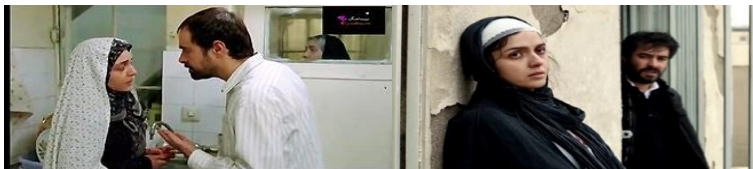
تصویر شماره ۲. فیلم جدایی نادر از سیمین و فیلم فروشنده

روال روایت و به صورت بخشی از روند داستان می‌بینیم. در تمامی فیلم‌های فرهادی، زنان (به‌استثنای لوسی) از جانب مردان تحت خشونت روانی قرار می‌گیرند و در این مسئله تفاوتی میان طبقات اجتماعی زنان و حتی جامعه بستر آنان (ایران، فرانسه یا اسپانیا) وجود ندارد.