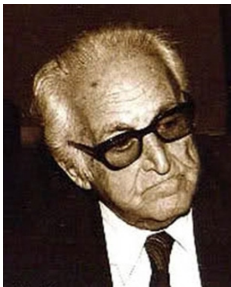
تصویر ۲. مر ترضی نی‌داوود

مر ترضی نی‌داوود موسیقی‌دانی برجسته و نام‌آشناست. شاید افراد بیشتر او را به‌سبب ساختن تصنیف مرغ سحر (با شعر ملک‌الشعرا بهار) بشناسند. اما تصنیف‌سازی یکی از قریح و استعدادهای شگرف او بود. او یکی از برجسته‌ترین نوازندگان تار در یک سده گذشته است که تأثیر بسزایی بر روی نوازندگان پس از خود داشته است. نی‌داوود کار حرفه‌ای خود را در اواخر