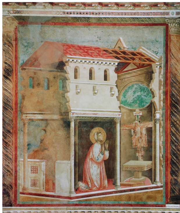
تصویر (۲): جوتو، سنت فرانسیس در سنت دامیانو دعا می‌کند، حدود سال ۱۳۰۰. آسیزی، سنت فرانچسکو