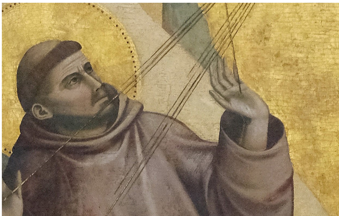
تصویر (۵): این اثر از جوتو هماهنگ با تئوری هندسه نور فرانسیسیکان و تئوری شرقی هندسه نور است.