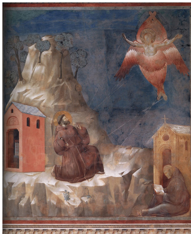
تصویر (۴): جوتو، سٹیگماتا (زخم خوردن) سنت فرانسیس، حدود ۱۲۹۵-۱۳۰۰، آسیسی، سان فرانچسکو، کلیسای فوقانی