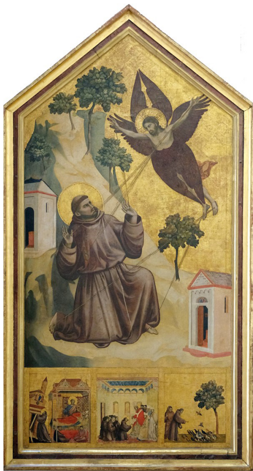
تصویر (۱): جوتو، سستیگماتا (زخم خوردن) سنت فرانسیس، حدود ۱۳۱۰/۱۳۰۰ میلادی. پاریس، لوور