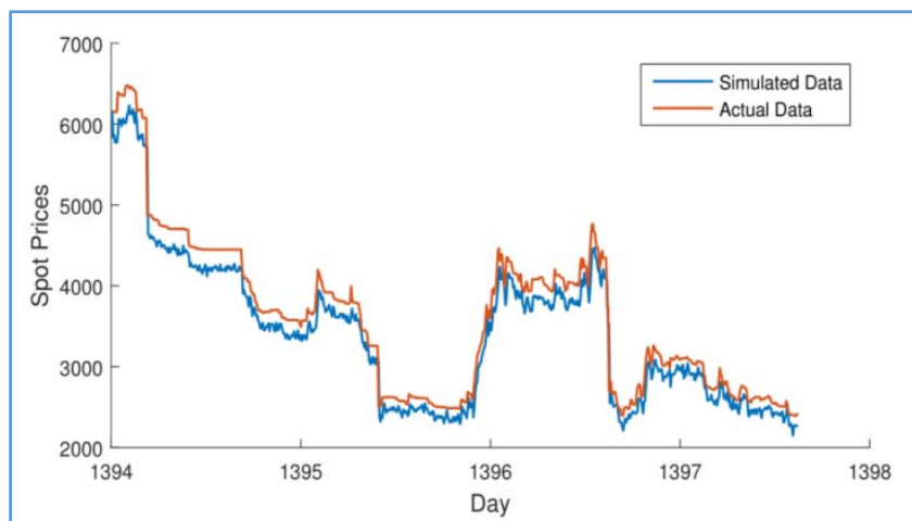
شکل ۱. مقایسه داده‌های شبیه‌سازی شده و داده‌های واقعی ارزش روزانه شاخص سیمان ارومیه