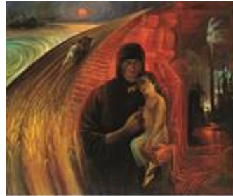
تصویر ۱۷. مقاومت، کاظم چلیپا، تاریخ اثر: ۱۳۶۲، تکنیک: رنگ و روغن، قطع اثر: ۱۲۰ در ۱۰۰.