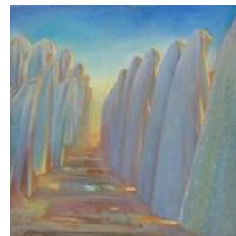
تصویر ۱۴. نماز، کاظم چلیپا، تاریخ اثر: ۱۳۷۳، تکنیک: رنگ و روغن، قطع اثر: ۱۲۰ در ۱۲۰.