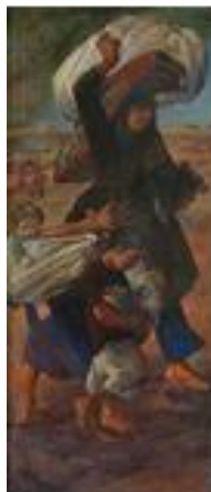
تصویر ۹. مهاجرت، کاظم چلیپا، تاریخ اثر: ۱۳۶۵، تکنیک: رنگ و روغن، قطع اثر: ۱۸۰ در ۸۰