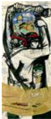
تصویر ۷. جنگاوران جبهه نور، کاظم چلیپا، تاریخ اثر: تصویر ۸. ریشه در عشق، کاظم چلیپا، تاریخ اثر: ۱۳۶۵، تکنیک: ترکیب مواد، قطع اثر: ۲۰۰ در ۸۰. ۱۳۵۹، تکنیک: رنگ روغن، قطع اثر: ۲۰۰ در ۷۰.