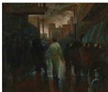
تصویر ۱۱. بسیجی، کاظم چلیپا تاریخ اثر: ۱۳۶۴، تکنیک: رنگ و روغن، قطع اثر ۲۰۰ در ۱۸۰.