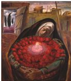
تصویر ۱۶. کویر، تاریخ اثر: ۱۳۶۳، تکنیک: رنگ و روغن، قطع اثر: ۱۶۰ در ۱۳۰.

با توجه به این که نقاشی دوران انقلاب اسلامی علاوه بر واقع‌گرایی دارای جنبه‌هایی ماورائی، نمادین و عاطفی نیز بوده است، در آثاری از این هنرمند با محتوای زن، بیشتر شاهد بهره‌گیری از جنبه‌های نمادین با رویکردهای عاطفی ۱ هستیم. استفاده از این رویکرد را در آثار دوران انقلاب چلیپا می‌توان دید که منجر به نمایش بخشی از هویت ملی زن در آثارش شده است.