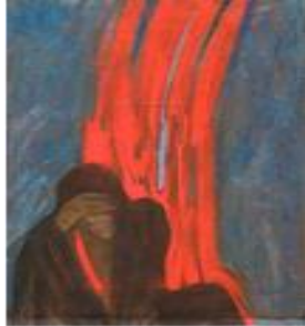
تصویر ۱۸. رحلت امام، کاظم چلیپا، تاریخ اثر: ۱۳۶۸، تکنیک: رنگ پلاستیک، قطع اثر: ۱۰۰ در ۷۰.