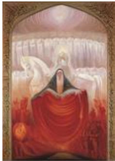
تصویر ۱۳. اینار، کاظم چلیپا، تاریخ اثر: ۱۳۶۰، تکنیک: رنگ و روغن، قطع اثر: ۲۰۰ در ۳۰۰.