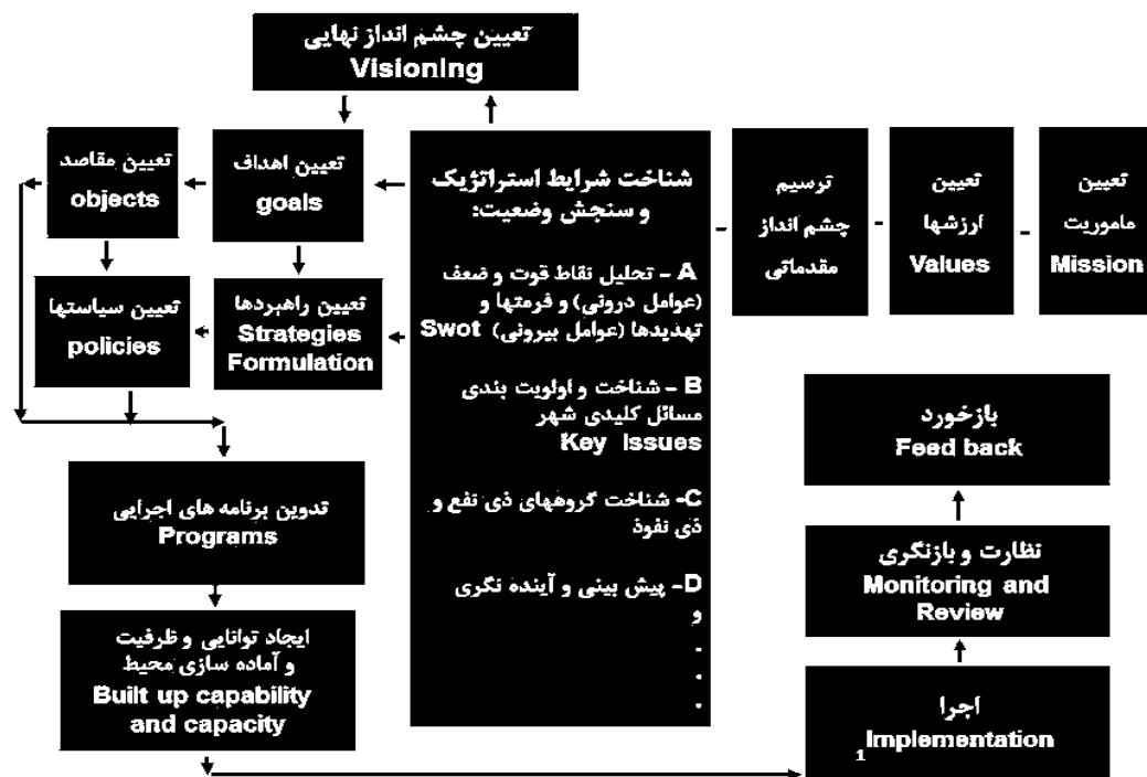
شکل ۱. فرایند کلی طرح راهبردی و جایگاه چشم‌انداز در آن؛ منبع: (سعیدی رضوانی، ۱۳۹۰)

برنامه‌های میان‌مدت پنج‌ساله معمولاً به سه صورت تهیه و تدوین می‌گردند؛ نوع اول این برنامه‌ها که به «برنامه‌های پروژه به پروژه» معروف می‌باشند، معمولاً در تجارب اول برنامه‌ریزی انجام می‌شوند. در این نوع برنامه‌ریزی، به دلیل فقدان اطلاعات، ابزار و تشکیلات سازمانی لازم، تنها به انتخاب تعدادی پروژه کلان مبادرت می‌شود و فرآیند برنامه‌ریزی که شامل تدوین و تنظیم اهداف، ارزیابی بازتاب‌های دستیابی به اهداف، انتخاب گزینه‌های اجرایی و ارزشیابی و اولویت‌بندی طرح‌ها و پروژه‌ها می‌باشد، صورت نمی‌گیرد. لذا در این نوع برنامه‌ریزی، اتلاف منابع و عدم موفقیت عملکردی پروژه‌ها به دلیل عدم اجرای طرح‌ها مکمل و متمم دور از انتظار نیست. نوع دوم برنامه‌ریزی‌های میان‌مدت، «برنامه‌ریزی یکپارچه سرمایه‌گذاری بخش عمومی» می‌باشد که به دلیل توجه به ارتباط میان طرح‌ها و پروژه‌ها، از کارایی بهتری برخوردار است. انتظار می‌رود که پس از اجرای چند برنامه از این نوع و تقویت توان تهیه و اجرای نهادهای برنامه‌ریزی، نوع سوم برنامه‌ریزی که تحت عنوان «برنامه‌ریزی جامع» نامیده می‌شود در دستور کار قرار گیرد. این نوع برنامه‌ریزی مستلزم مدل‌سازی و بهره‌گیری از داده‌های اطلاعاتی گسترده در ابعاد مختلف می‌باشد (شهرداری شیراز، ۱۳۹۲).