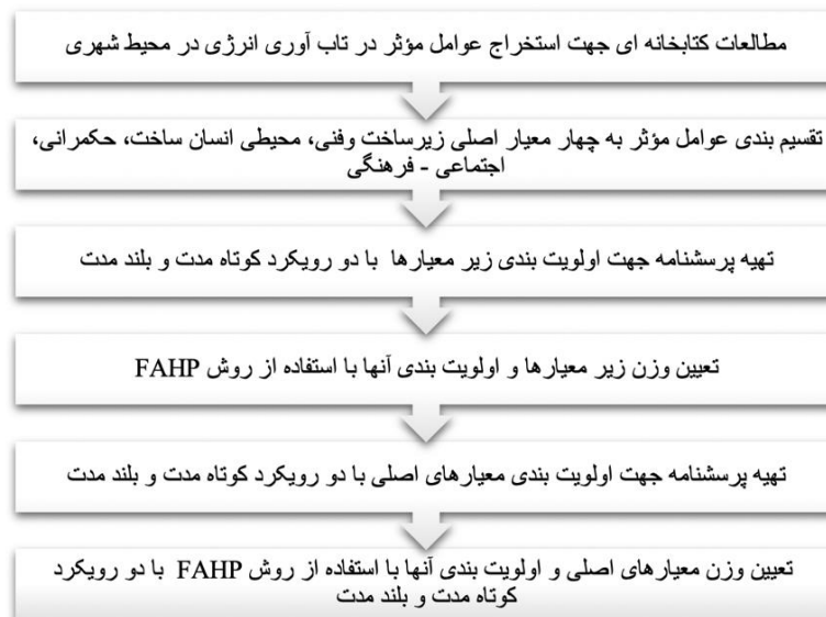
شکل ۲. مراحل تحقیق

اساتید، متخصصان و مدیران دولتی در حوزه انرژی بودند. پرسشنامه تهیه شده برای سنجش اهمیت هر یک از زیر معیارها در تاب‌آوری انرژی شهری در دو رویکرد کوتاه مدت و دراز مدت به تفکیک در طیف لیکرت با مقیاس پنج درجه طراحی گردید. پس از دریافت پاسخ از خبرگان، نتایج در نرم‌افزار آماری SPSS ثبت شده و پایایی پرسشنامه سنجیده شد. برآورد پایایی با استفاده از تعیین همبستگی درونی با روش آلفای کرونباخ که شایع‌ترین روش آماری برای بدست آوردن پایایی است، صورت گرفت. (جدول ۷) از آنجایی که عوامل مؤثر بر اساس میزان فراوانی در منابع معتبر استخراج گردیدند روایی آنها تا حد زیادی قابل قبول می‌باشد. سپس اولویت بندی زیر معیارها در هر یک از چهار زیرگروه فنی و زیرساختی، محیطی انسان ساخت، حکمرانی و اجتماعی - فرهنگی با انجام مقایسه زوجی و استفاده از روش FAHP به صورت جداگانه و در دو رویکرد کوتاه مدت و بلند مدت به تفکیک صورت گرفت. نرخ ناسازگاری نیز محاسبه شد و با توجه به آنکه عدد بدست آمده در هر یک از