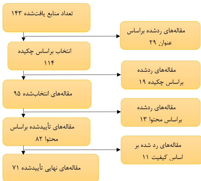
شکل ۱. شیوه انتخاب مقاله‌ها

مقاله انتخاب شد. جهت ارزیابی کیفیت این پژوهش‌ها از روش ارزیابی حیاتی کسپ (CASP) استفاده شد. در شکل ۱ شیوه انتخاب مقاله‌ها در این مرحله ارائه شده است.