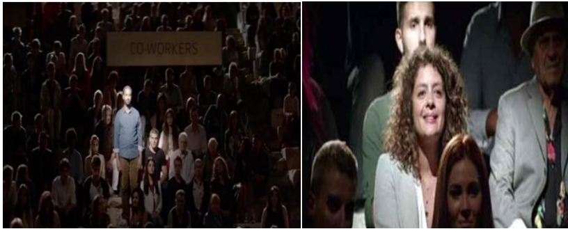
تصویر ۵ و ۶

در واقع مرد با هر جمله ای که می گوید دوره های زندگی خود را برمی شمارد و در نهایت فضا را شخصی می کند و افراد را "خاص" ترا! سازندگان بسیار هنرمندانه تأثیر خاص بودن این افراد را بر مخاطب القا می کنند. صحنه بعدی، لبخند رضایتی که مرد روی صحنه به افراد خاص زندگی اش نثار می کند را در قاب منعکس می سازد (تصویر ۷).