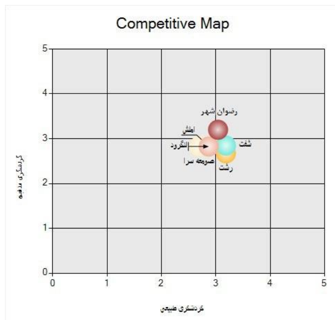
شکل شماره ۲. نقشه رقابتی، استراتژی توسعه گردشگری مذهبی شهرستان رضوانشهر

شهرستان رضوانشهر نسبت به سایر رقبا نشان داده شده است.