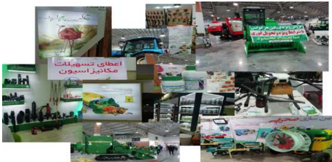
تصویر ۱. تبلیغات و مشوق‌های خرید

نظریهٔ چرخهٔ تولید به جامعهٔ مدرن و صنعتی می‌پردازد و دربارهٔ سودجویی شرکت‌ها، نقش و تأثیر دولت و نهادهای دولتی در حفظ یا تخریب محیط زیست، نابرابری‌ها در قدرت تصمیم‌گیری دربارهٔ محیط زیست و نیز نابرابری در درگیری با پیامدهای این تصمیم‌ها و شرایط بد محیط زیستی نیز توضیح می‌دهد. اشنایبرگ مطرح می‌کند که رقابت در اینجا بر سر دستیابی به منابع بیشتر برای تولید بیشتر و سود بیشتر است. امروزه، در کنار روش سنتی کشت توسط کشاورزان مازندرانی، شرکت‌های تولیدی، کشت و صنعت‌ها، کارخانجات تولید و فروش خوراک دام و طیور و غیره نیز قرار گرفته‌اند که مبتنی بر کسب سود هستند و صنعت‌گرایی (عنبری، ۱۳۹۵: ۳۵) مشخصهٔ بارز آن‌هاست.