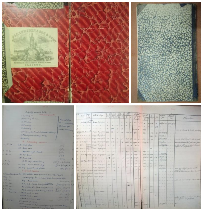
تصویر ۱ تا ۴)

رو و توی جلد و برگهایی از سند خطی خانوادگی مورد تحقیق