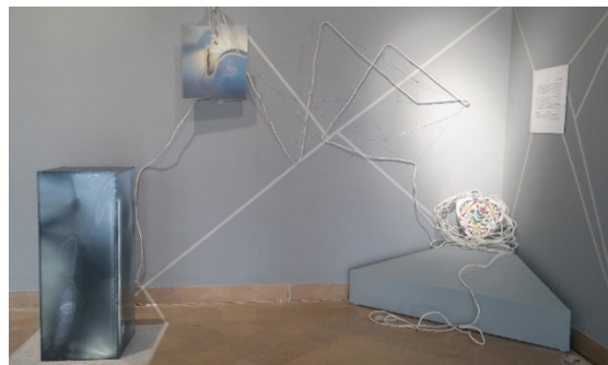
تصویر ۱- پناهگاه، ۱۳۹۸.

استعاره‌ها، ایهام، عدم ارائهٔ معنای روشن و قطعی: استفاده از روش روایتی در جلسه‌های هنردرمانی منجر به تقویت ارتباط درمانی می‌شود. استفاده از استعاره‌ها بخش مهمی از هنردرمانی پُست‌مدرن محسوب می‌شوند که به درمانگر اجازه می‌دهند که وارد ساختار داستان