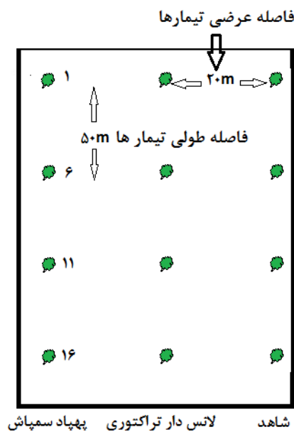
شکل ۳. موقعیت واحدهای آزمایشی

مقایسه کارایی روش‌های سمپاشی در کنترل زنجبرک خرما با طرح بلوک‌های کامل تصادفی و در چهار تکرار انجام شد. زمان محلول‌پاشی علیه زنجبرک خرما برای نسل زمستانه هم‌زمان با ظهور پوره‌های سن دوم و سوم با انجام بررسی‌های هفتگی از زمان ظهور پوره‌ها تعیین شد. به جز روش سمپاشی، کلیه عوامل برای تیمارها، یکسان بود. تیمارهای آزمایشی شامل: ۱- سمپاشی با پهپاد ۲- سمپاشی با سمپاش لانس‌دار تراکتوری ۳- شاهد (بدون سمپاشی) بودند. برای این منظور برای هر تیمار یک ستون کشت با ۱۶