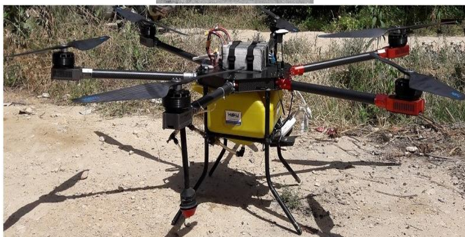
شکل ۱. پهپاد سمپاش (راست) و کاربرد کارت‌های حساس برای تعیین عرض کار مفید (چپ)