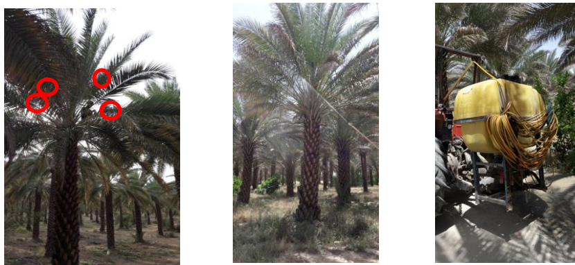
شکل ۲. سمپاش لانس دار پشت تراکتوری (راست)، لانس و بوم ۴ متری (وسط)، محل نصب کارت‌های حساس (چپ)