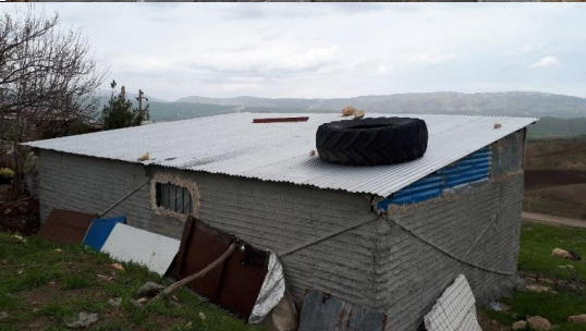
تصویر ۹. قرار دادن اجسام سنگین روی سقف برای مقابله با بلندشدن سقف بر اثر وزش باد و پوشاندن محفظه‌ها با استفاده از ورقه‌های سینوسی