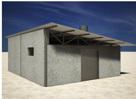
شکل ۱. نمای بیرونی ساختمان آغل طراحی شده