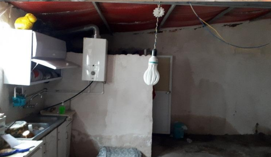
تصویر ۱۱. آغل با کاربری مسکونی- ایجاد ظرف‌شویی، نصب آب‌گرم‌کن و ایجاد حمام، سقف پشم‌شیشه، سیمان کردن کف و سفیدکاری دیوارها