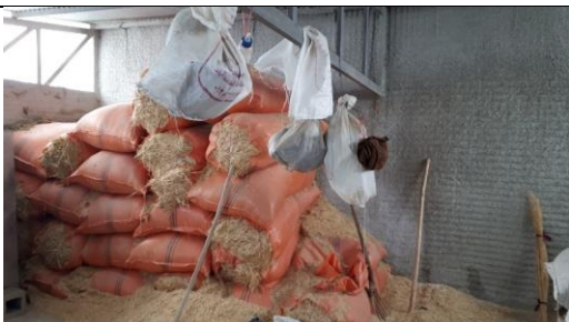
تصویر ۴: تبدیل آغل به انبار علوفه