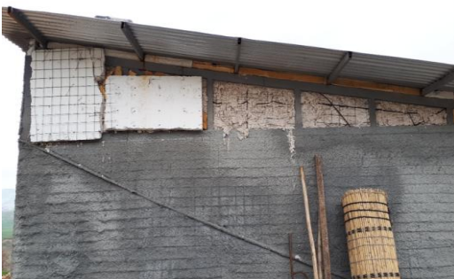
تصویر ۶: پوشاندن محفظه‌ها با استفاده از تکه‌های یونولیت