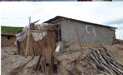
تصویر ۳. آغل با کاربری مسکونی - ایجاد ورودیه یا لابی حصیری