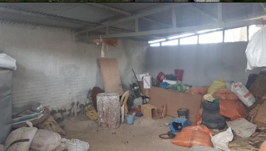
تصویر ۱۰. آغل با کاربری انبار- تقریباً بلااستفاده به دلیل نفوذ آب