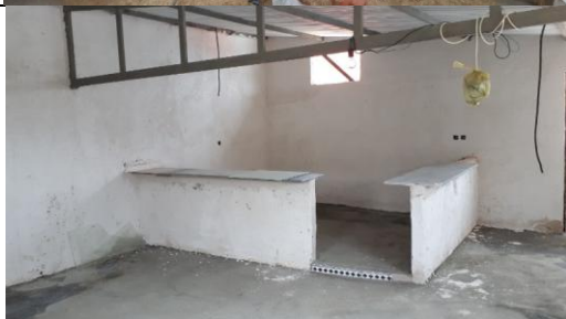
تصویر ۵: آماده‌سازی آغل برای سکونت (عایق کردن سقف با استفاده از پشم شیشه، ایجاد آشپزخانه آبن، پوشاندن کامل محفظه‌ها با سیمان و گچ، سیمان کردن کف، سفیدکاری دیوار و برق کاری)