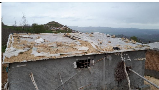
تصویر ۸. عایق‌بندی سقف با استفاده از خاک (ریختن خاک روی سقف فلزی، کشیدن نایلون روی خاک، و قراردادن اجسام سنگین روی نایلون)