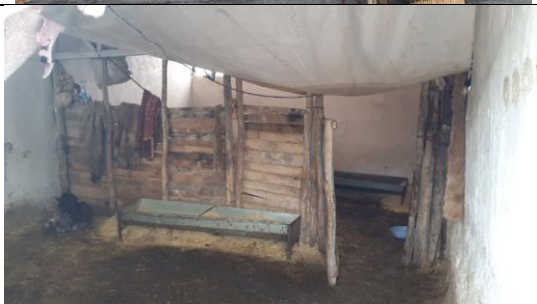
تصویر ۷: کشیدن پلاستیک زیر سقف برای جمع کردن آب ناشی از تعریق و نصب جداساز چوبی برای تفکیک دام سبک از سنگین (آب جمع شده در پلاستیک مشخص است)