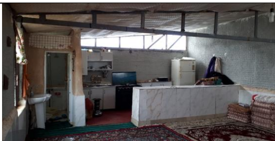
تصویر ۱. آغل با کاربری مسکونی - سقف پشم‌شیشه، آشپزخانه آبن، ایجاد ظرف‌شویی و روشویی، ایجاد حمام، نصب آبگرمکن، کاشی‌کاری

همان‌طور که بیان شد در حدود ۲۶ درصد از آغل‌ها به خانه (کاربری مسکونی) تبدیل شده‌اند. روستائیان برای تبدیل آغل به خانه تغییرات متعددی را در آن اعمال کرده‌اند. در بازدیدهای میدانی ۱۷ نوع تغییر مختلف مشاهده شد. تغییرات مزبور عبارتند از: ایجاد ورودیه یا لابی، دیوارکشی و تبدیل فضای آغل به دو بخش مجزا، سیمان کردن کف، سفیدکاری دیوارها، عایق‌بندی سقف و پوشاندن محفظه‌ها، ایجاد درب ورودی، ایجاد درب جدید (برای فضای جداشده)، ایجاد پنجره جدید، بزرگ‌تر کردن پنجره موجود، نصب بخاری و دودکش، نصب آبگرمکن، ایجاد حمام، نصب روشویی، ایجاد آشپزخانه آبن، نصب ظرف‌شویی، نصب پنکه سقفی و کاشی‌کاری. برای نمونه به تصاویر ۱ تا ۱۱ نگاه کنید.