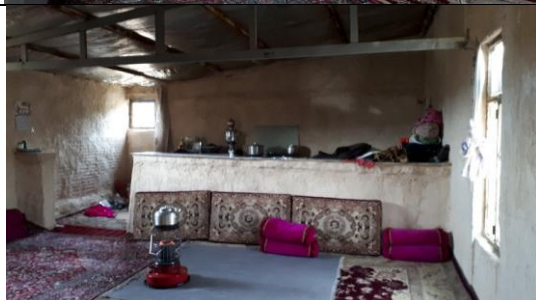
تصویر ۲. آغل با کاربری مسکونی - پوشاندن محفظه‌ها، ایجاد پنجره جدید، آشپزخانه آبن، سفیدکاری دیوارها، عایق کردن سقف با پشم شیشه